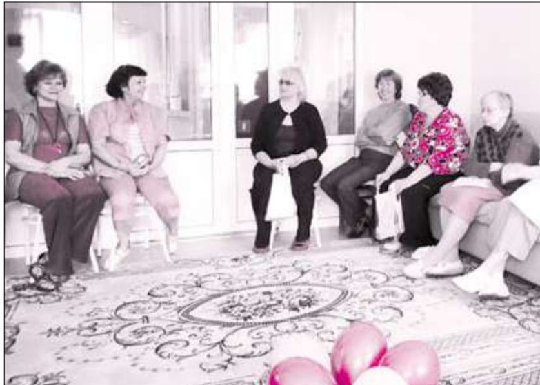
В комнате отдыха.

Кроме того, в социальном доме оборудованы кабинеты для кружковой работы и трудотерапии, компьютерный класс, гостиная для организации досуга, актовый зал, конференц-зал, «зимний сад», столовая. А для тех, кто заботится о своем физическом, душевном здоровье и внешности – зал лечебной физкультуры с тренажерами,