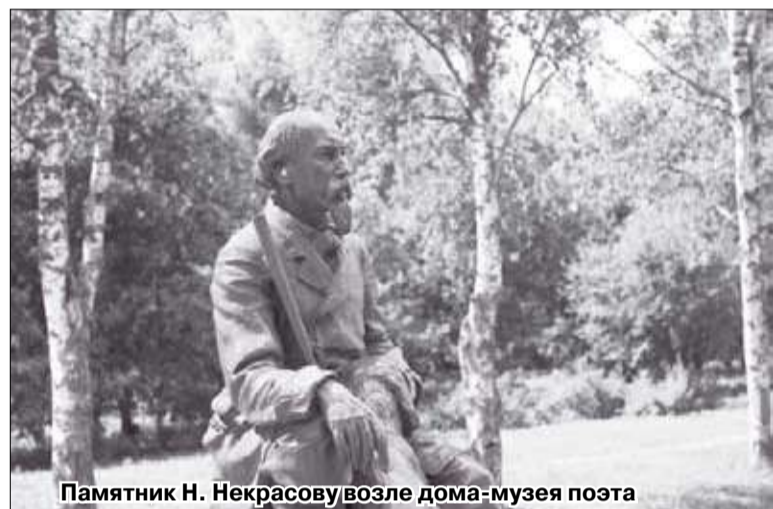
Памятник Н. Некрасову возле дома-музея поэта