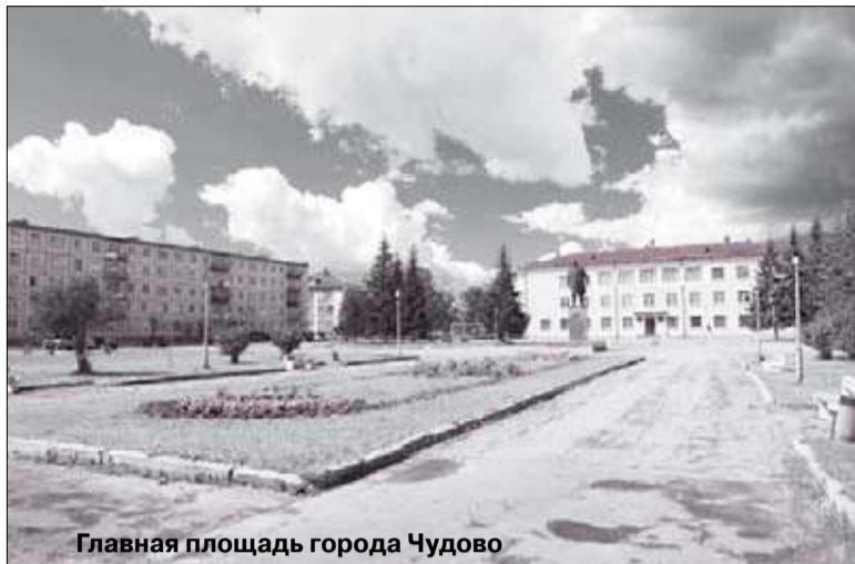
Главная площадь города Чудово

В теплой атмосфере прошло и само заседание, на котором обсуждались преимущества взаимной поддержки. «У нас очень развита аграрная промышленность. Хорошо растут фрукты и овощи. Так что Чудово может