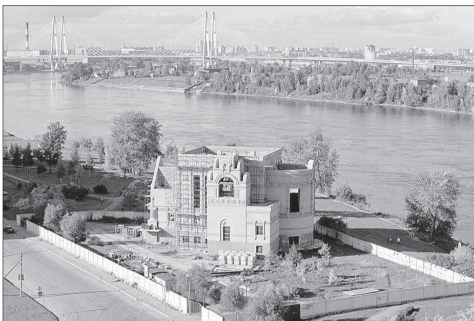
Зеленую зону возле Храма Рождества Пресвятой Богородицы удалось сохранить

Вторым важнейшим законом является закон о бюджете. Точнее, серия законов, так как бюджет секвестировался в 2009 году из-за мирового кризиса. Доходы в начале года упали почти в два раза. Но Санкт-Петербург – молодец (спасибо всем нам) – начал выбираться из финансовой ямы с осени. И, в отличие от других российских регионов, восстановил доходы своего бюджета к зиме. График выхода из кризиса оказался примерно таким же, как и в Европе. В этом смысле мы вполне европейский город. Если будем продолжать в том же духе, сможем приблизиться к европейским стандартам проживания. Именно такую главную цель имеет Стратегический план развития города. Эта же цель определяет политику, которую Единая Россия проводит в Санкт-Петербурге, что создает прочный фундамент для эффективного взаимодействия исполнительной и законодательной ветвей