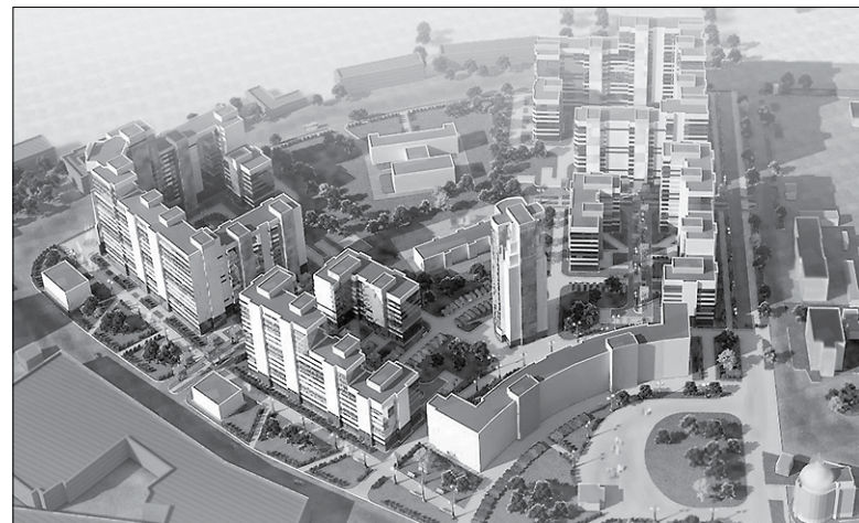
Так будет выглядеть Щемиловка

Это будут современные монолитные жилые здания – от 5 до 23 этажей.