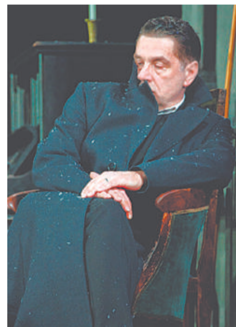
▲ «Евгений Онегин»

мотался по гостиницам и потом приехал: вот он я. Потому он и наказан. Я выбираю в героиню женщину – Татьяну! Она – это любовь, верность, преданность, мука, боль, красота. В этом вся русская женщина. А мужчины там кто? Неудачники!»