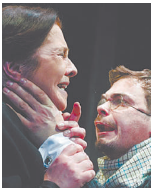
▲ «Мать. Васса Железнова».

Брам Янсен, напротив, отделяет зрителей звуконепрозрачной прозрачной перегородкой и комментирует то, что происходит на сцене. Спектакль «Смотреть на Жюли» амстердамского театра говорит, конечно, о каких-то важных вещах, но первой реакцией каждого посетителя после него будет желание оглядеться – нет ли прозрачной стены!