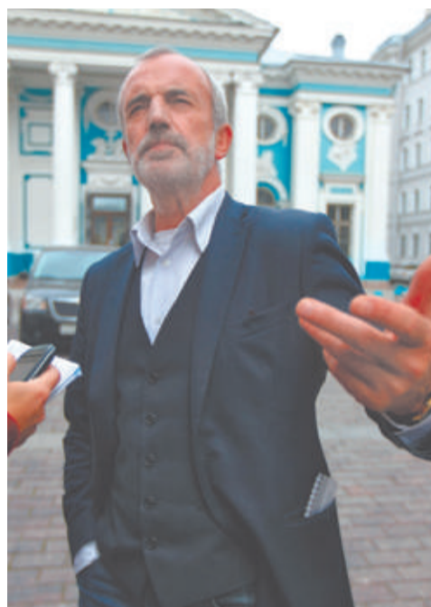
▲ Римас Туминас