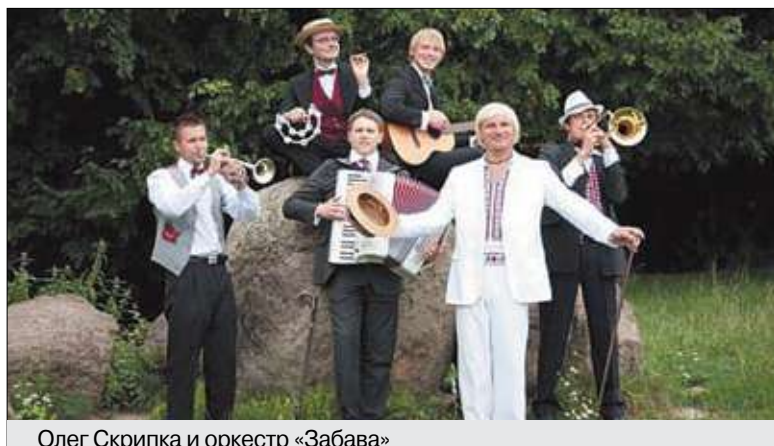
Олег Скрипка и оркестр «Забава»