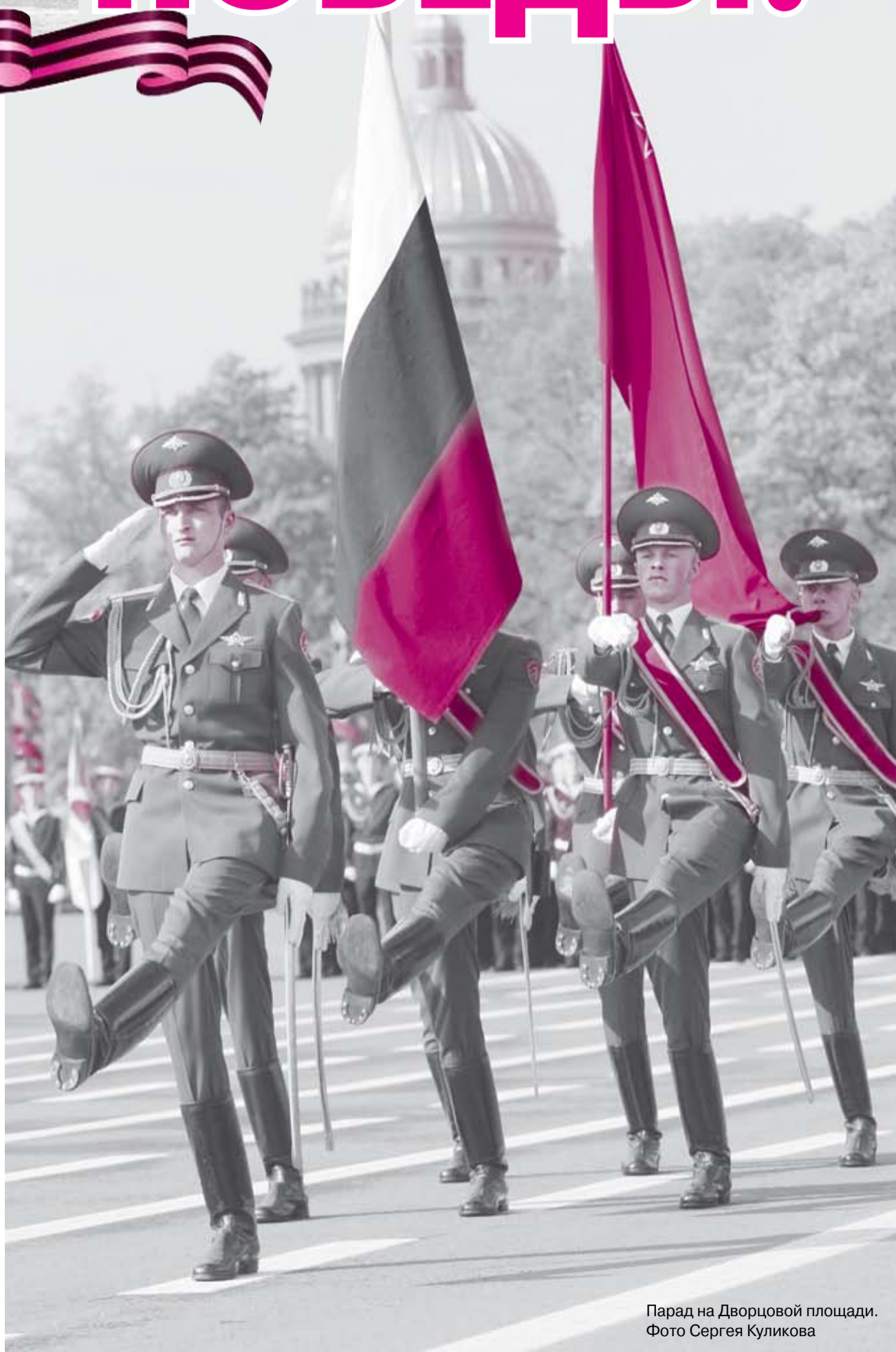
Парад на Дворцовой площади.

Редакция портала продолжает сбор информации. Каждый желающий может присылать текстовые документы и фото на электронный ящик leningradpobeda@mail.ru .