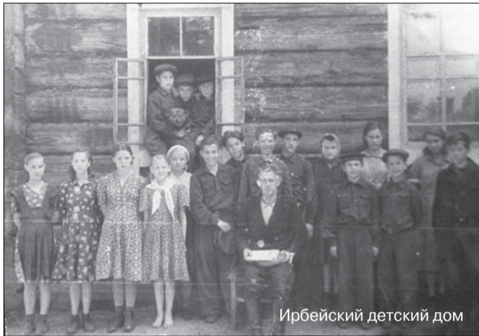
Ирбейский детский дом

Блокада и оборона Ленинграда явили миру высочайшие образцы героизма и нравственной стойкости его жителей. Ко времени смыкания блокадного кольца внутри города оказалось около 3 млн человек, при этом более 400 тыс. из них составляли дети. В первую же блокадную зиму десятки тысяч из них, потеряв родителей, стали сиротами. Для их спасения формировались детские дома, действовавшие в тяжелейших условиях. Детей, в первую очередь, старались вывезти на Большую землю по Дороге жизни.