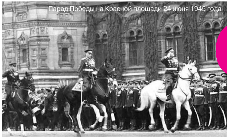
Парад Победы на Красной площади 24 июня 1945 года