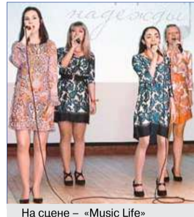
На сцене – «Music Life»