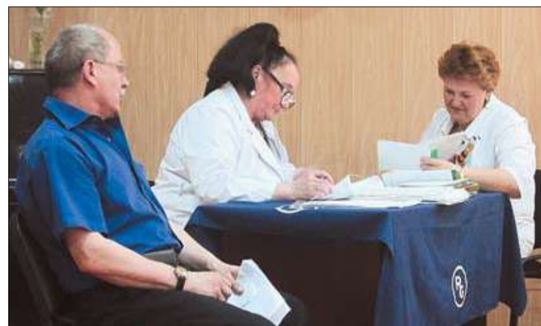
– На что жалуетесь, больной?