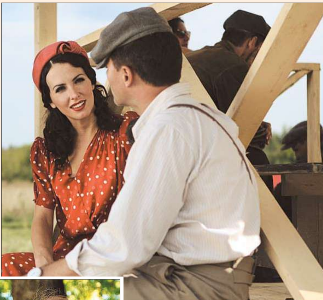
Кадр из сериала «Есенин»

Жуков, поневоле позвоночный столб выпрямляется, осанка становится гордой, а душу переполняет ощущение важности сериала, в котором легендарные личности мечутся между своими женщинами и сильно от этого страдают.