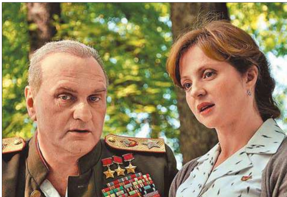
Кадр из сериала «Жуков»

Зрители вправе выбирать себе историческое телезрелище в соответствии с собственными вкусами, знаниями и желаниями. Главное – помнить, что изучать родную историю по подобным сериалам никак нельзя. Муза Клио пока еще