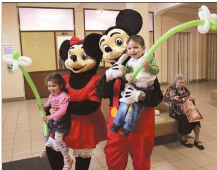
В фойе «Троицкого»