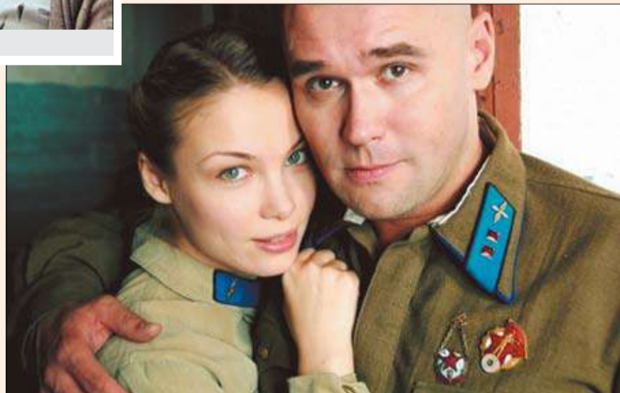
Кадр из сериала «Фурцева»

В определенной степени зрителям уже наскучили истории о личной жизни современных «звезд» шоу-бизнеса, политики и искусства. Тем более что в кадре постоянно мелькают одни и те же лица. А когда на телеэкране появляется сам маршал