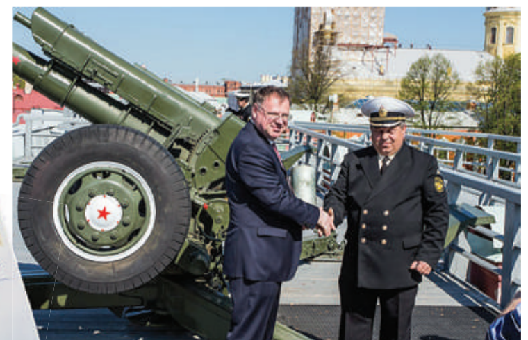
На память о полуденном выстреле из пушки Петропавловской крепости генеральному директору Обуховского завода торжественно была вручена гильза от снаряда