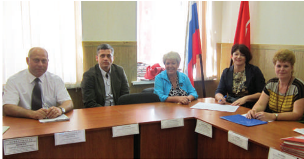
«Члены призывной комиссии совсем не страшные»

– Да, стандартная причина отказа от службы в армии – состояние здоровья. Однако мы сталкиваемся с большим числом симулянтов. Советую помнить, что документы, подтверждающие наличие заболевания, принимаются только от учреждений из строго ограниченного перечня. Коммерческие центры, готовые за деньги вписать любой диагноз, только окажут медвежью услугу. Когда у комиссии возникают сомнения, призывник отправляется на дополнительное медицинское освидетельствование. Кстати, в армии