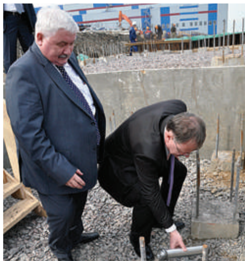
Закладка капсулы в основание будущего корпуса

16 мая исполнилось 150 лет со дня основания ОАО «ГОЗ Обуховский завод», который входит в состав крупнейшего Концерна ПВО «Алмаз – Антей».