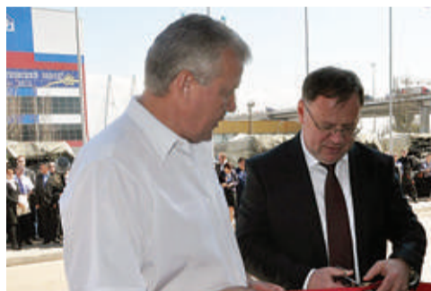
Разрезание красной ленточки в честь открытия новой проходной