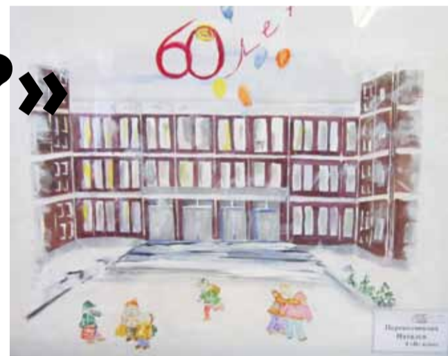
Встречу выпускников украсил вернисаж из работ, сделанных руками учеников и их родителей.