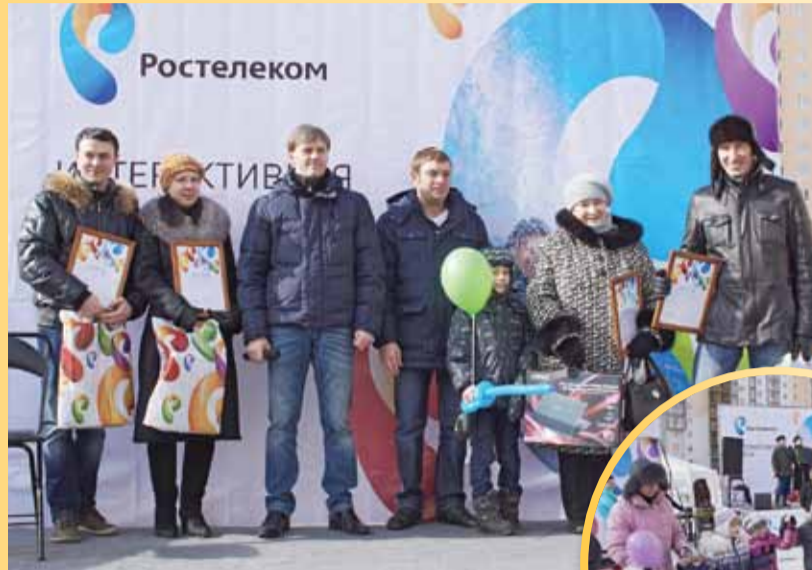
Компания не впервые приходит к петербургским новоселам с праздником.

Жители заворуженно крутили туда-сюда новости, видимо, представляя, как будут спокойно готовить ужин или гулять с детьми, а вечерами смотреть индивиду-