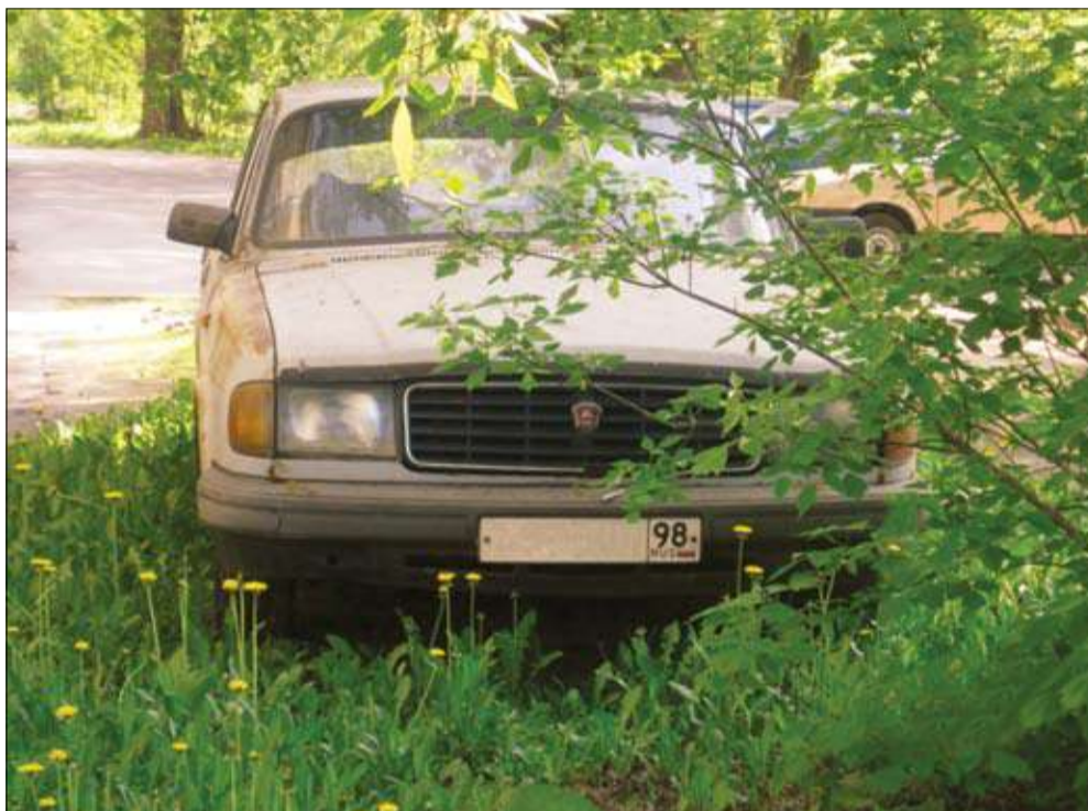
Парковка на газонах, к сожалению, не редкость.

По результатам городского смотра-конкурса на лучшее комплексное благоустройство территорий Санкт-Петербурга Невский район занял 3-е место среди I группы. По номинации «Квартал» городской комиссии был представлен квартал, ограниченный Рыбацким пр., Прибрежной ул., Шлиссельбургским пр., ул. Дмитрия Устинова, общей площадью 17,88 га. Более 6000 человек стали жителями квартала-сада с аккуратными набивными дорожками, газонами, новыми детскими площадками. Здесь максимально учтена возможность устройства уширения под парковку машин. Такие же благоприятные изменения коснулись двора