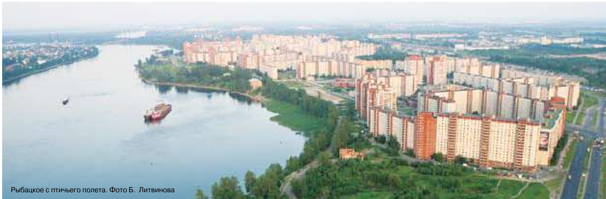
Рыбачье с птичьего полета.