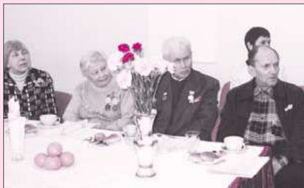
ДЕТДОМОВЦЫ БЛОКАДНОГО ЛЕНИНГРАДА ПОМНЯТ СВОЙ ГИМН