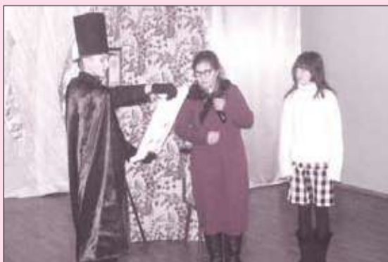
В ШКОЛЕ №34 ОСОВРЕМЕНИЛИ «СНЕЖНУЮ КОРОЛЕВУ»