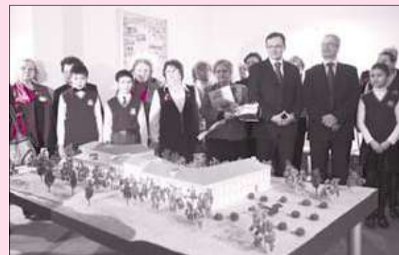
НА КУРАКИНОЙ ДАЧЕ ЗАРАБОТАЛА «МАШИНА ВРЕМЕНИ»