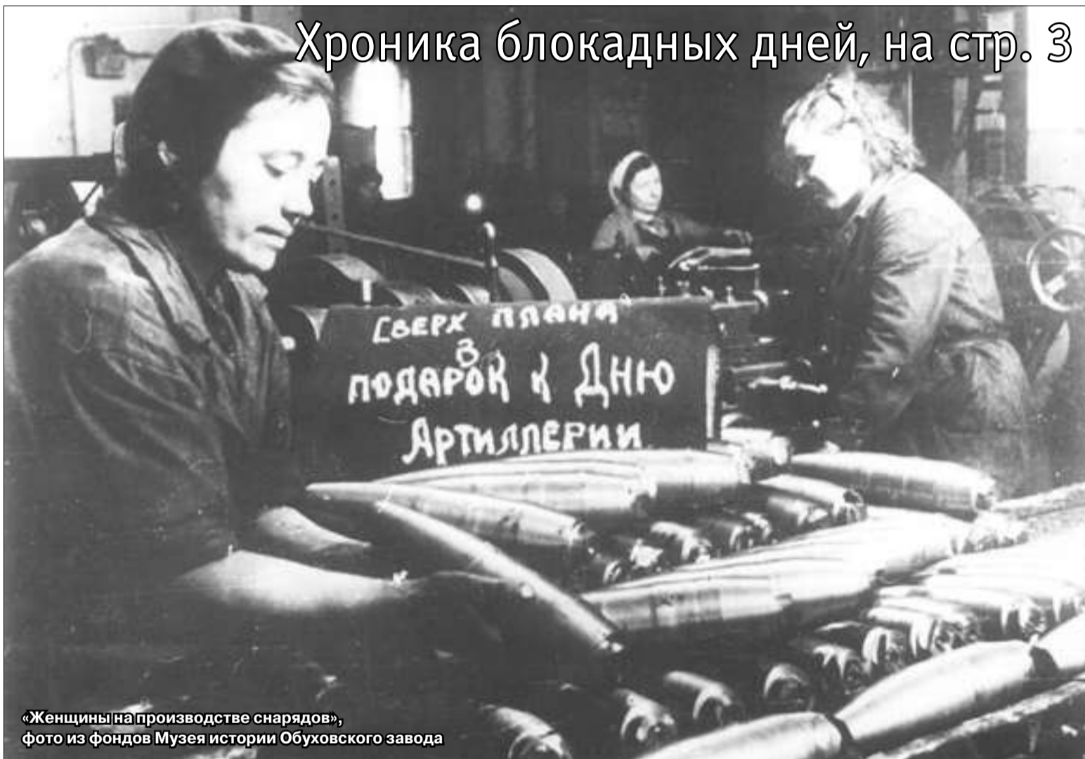
«Женщины на производстве снарядов», фото из фондов Музея истории Обуховского завода