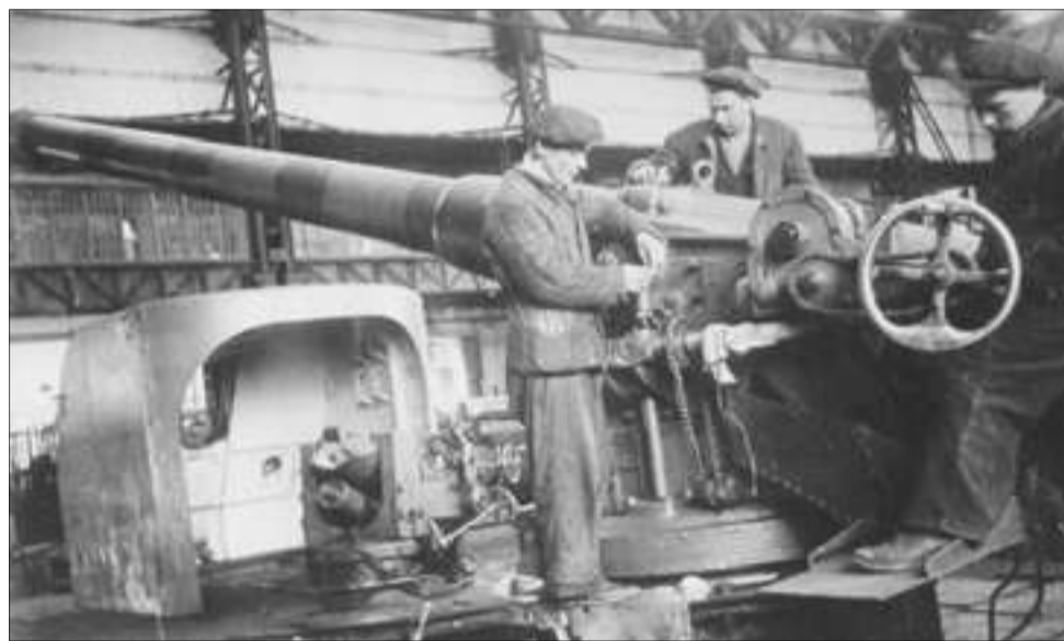
Сборка орудий в цехе № 3 в военные годы

Началась подготовка к зиме: изготавливали и монтировали печки-временки («буржуйки»), заготавливали дрова, делали свечи. Но завод