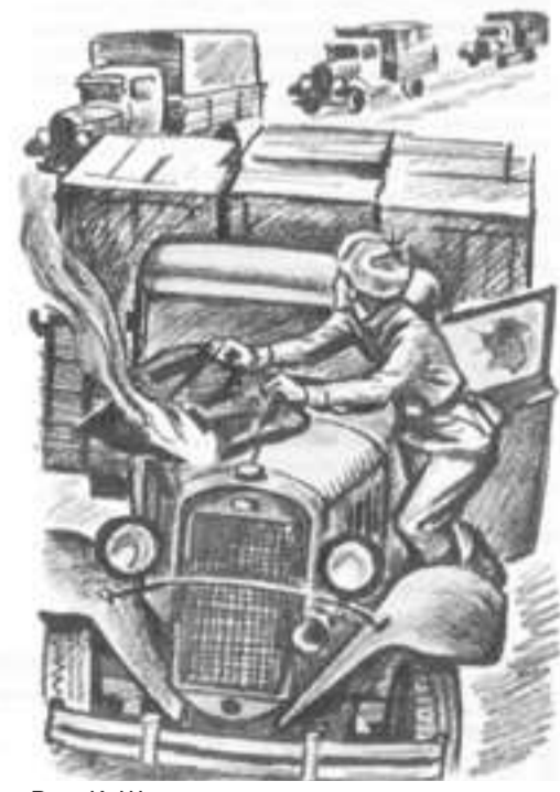
Рис. К. Швеца Из книги «Был город-фронт, была блокада»