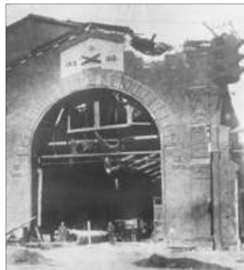
Разрушенный цех № 48 после артиллерийского обстрела

Для защиты завода в районе Ям-Ижоры – Колпино – Усть-Ижоры были размещены 14-й гвардейский артполк, два разведдивизиона, отряд аэростатов заграждения и отдельный артдивизион. На заводе находился офицер-наблюдатель с радиостанцией, который по