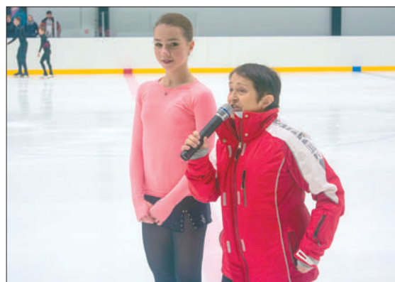
Выдающийся тренер Тамара Николаевна Москвина воодушевила всех своим оптимизмом.