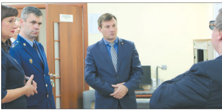
У клиентов центра появилась возможность узнать ответы на свои вопросы из первых рук – от руководства района.