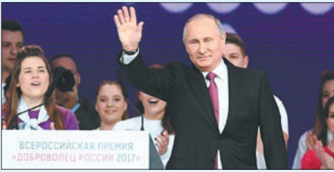
6 декабря. Москва. Путин на форуме «Доброволец»

На встрече с ветеранами и тружениками Горьковского автомобильного завода в Нижнем Новгороде президент России Владимир Путин объявил о своем намерении вновь баллотироваться на пост главы государства. «Лучшего места и лучшего повода для объявления об этом, наверное, и нет. Спасибо вам за поддержку, я буду выдвигать свою кандидатуру на должность президента Российской Федерации. Уверен, что все у нас с вами получится, благодарю вас», – сказал Владимир Путин. Напоминаем, что выборы состоятся 18 марта 2018 года.