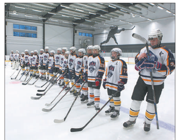
На льду – будущие чемпионы мира.