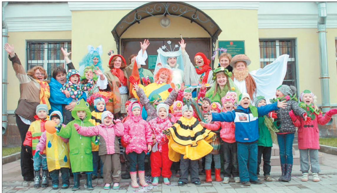
Желаем коллективу и воспитанникам детского сада № 25 только счастливых дней!

ДЕТСКИЙ САД № 25 ОТМЕЧАЕТ 80-ЛЕТИЕ. МЕНЯЮТСЯ ВРЕМЕНА, ЛЮДИ, ВОСПИТАННИКИ, НО НЕИЗМЕННЫМ ОСТАЕТСЯ ОДНО – ЛЮБОВЬ К СВОЕМУ ДЕЛУ И К ДЕТЯМ.