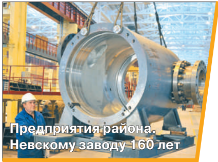
Предприятия района. Невскому заводу 160 лет