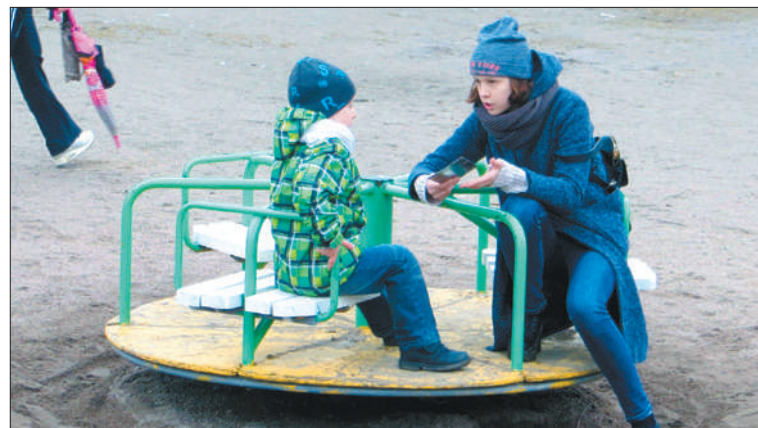
Увести ребенка с детской площадки может и женщина, и подросток. В России в год пропадает 16 тысяч детей!

Мы считаем, что наш проект крайне важен! Мы очень рады, что благодаря «Доброфоруму» о нем узнало такое количество людей. А самая большая благодарность – школе, которая под-