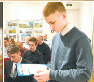
На торжественной церемонии ребята получили паспорта и напутствия.