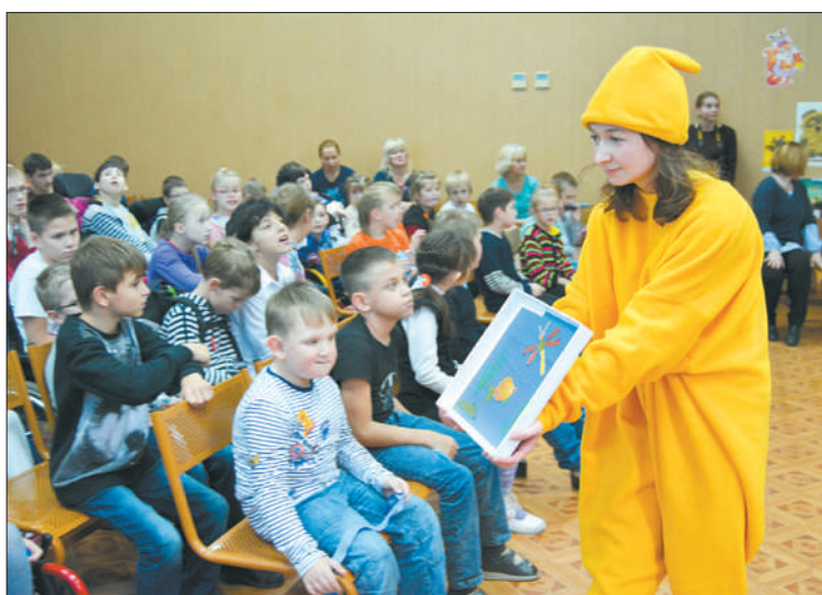
Бережному отношению к природе ребят учил солнечный зайчик.

– Такие мероприятия позволяют не только рассказать о про-