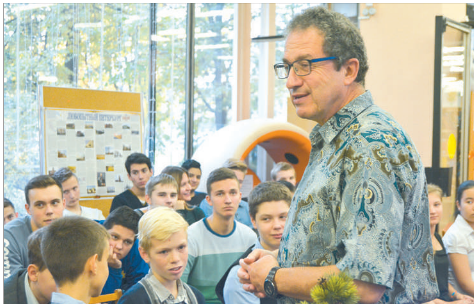
Особенно поразила слушателей история 89-летнего путешественника, которого Жорж Азра встретил в пустыне Оман.

– Айсберги на фото в основном синего цвета. Но не потому, что я их обработал. Они в действительности такие, – объясняет Жорж Азра, указывая на одну из пятидесяти фотографий. – Лед – это компактный снег. Когда он накапливается и меняет свою молекулярную структуру, появляются слои внутри льда. Из-за этого происходит преломление света. По его оттенкам можно определить возраст айсберга. Чем лед плотнее, чем