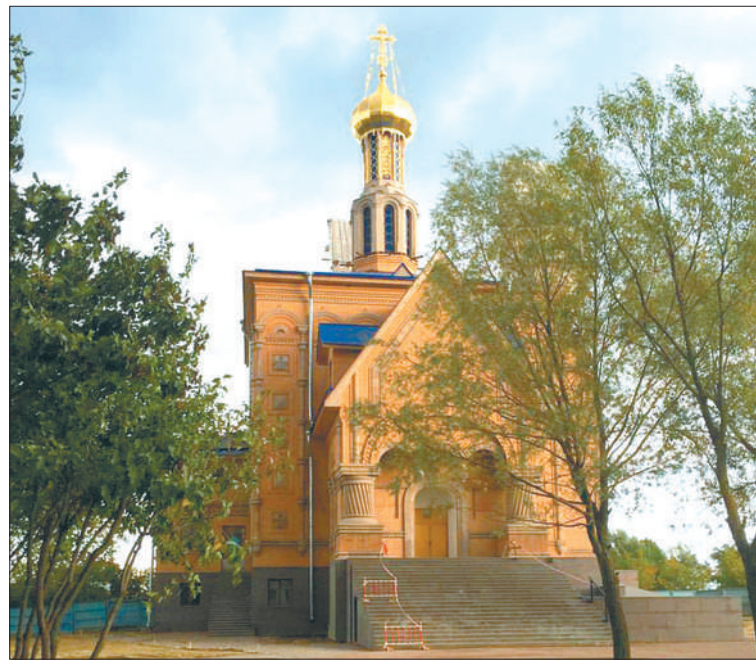
Храм Рождества Пресвятой Богородицы в Рыбацком.