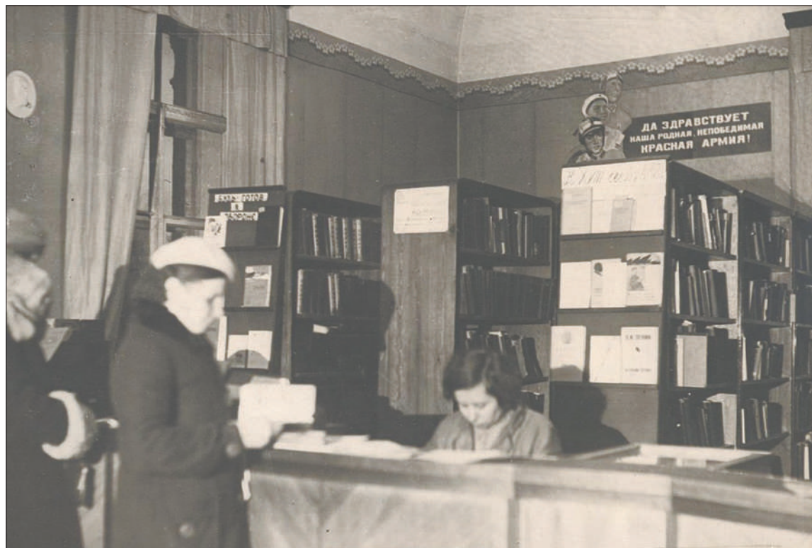
Библиотека им. Н.К. Крупской по адресу: проспект Обуховской Обороны, д. 143 (1939 год).