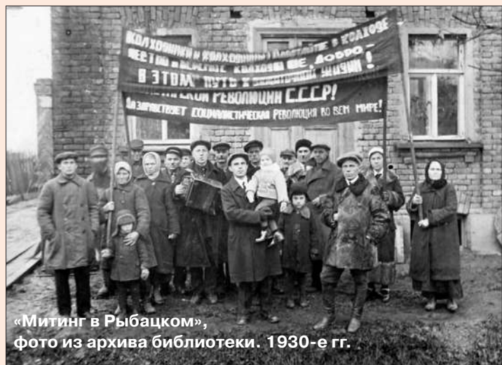
«Митинг в Рыбацком», фото из архива библиотеки. 1930-е гг.