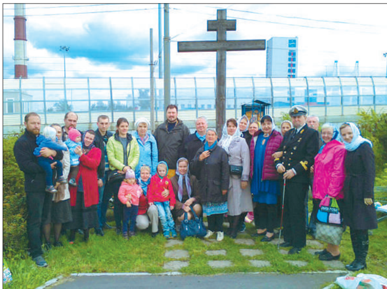
Верующие собираются у Поклонного креста в любую погоду, чаще – после работы, чтобы вместе с батюшкой принять участие в коллективной молитве.

В сентябре того же года инициативная группа обратилась в районную администрацию с