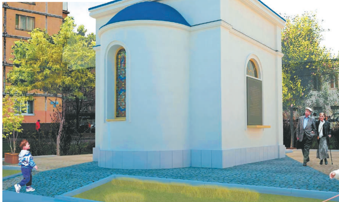
Жители района верят, что этот проект часовни скоро станет реальностью.