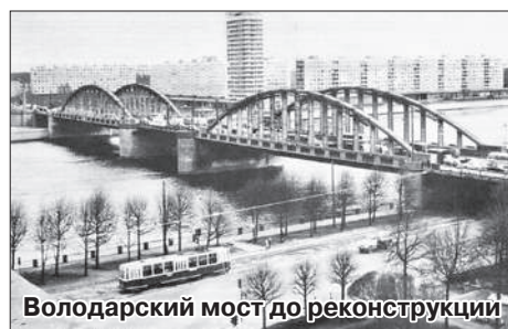
Володарский мост до реконструкции