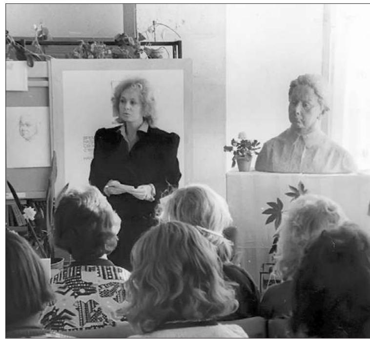
Библиотека отмечает 120 лет со дня рождения Н.К. Крупской (1989 год).