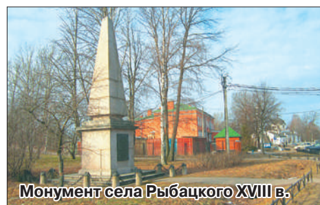
Монумент села Рыбацкого XVIII в.