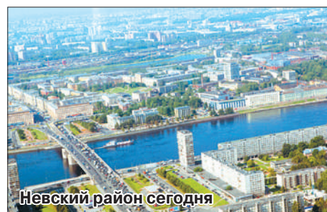
Невский район сегодня