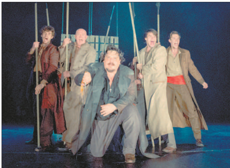
Спектакль «Тарас» – это настоящий Гоголь: с его мистикой, страстью и любовью.