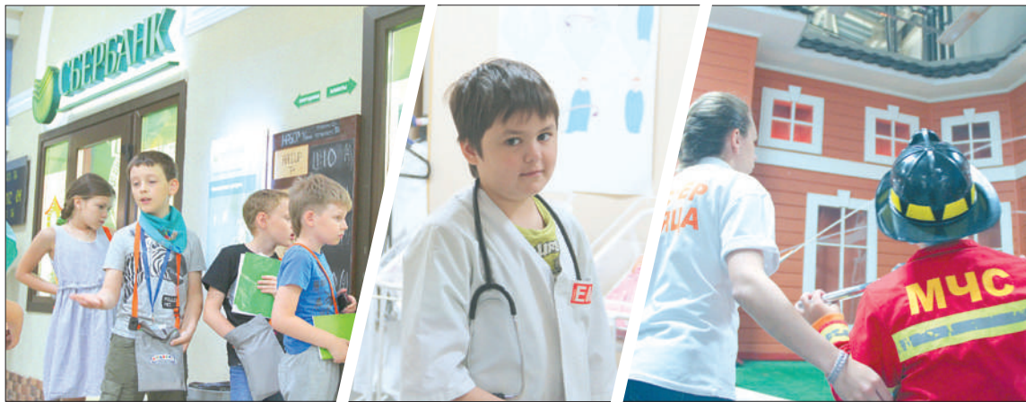
В детском городе профессий «Кидбург» все по-настоящему: работают больница, банк, почта, полицейский участок, театр и даже салон красоты.

Взрослая жизнь начинается сразу же после входа в городок.