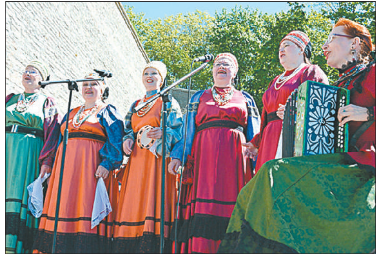
На празднике национально-культурных обществ русские народные песни исполнял и хор ветеранов из МО Красненькая речка Кировского района Петербурга.

А на следующий день петербуржцы приняли участие в традиционном праздничном шествии. «То, что Петербург идет с нами в одной колонне – это знак того, что наши отношения отличные, – заметил мэр Нарвы, – что мы хотим дружить, что мы любим друг друга». Шествие завершилось у стен Нарвской крепости гала-концертом музыкальных коллективов. Во дворе Нарвского замка играли на баяне и пели русские