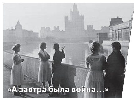
«А завтра была война...»