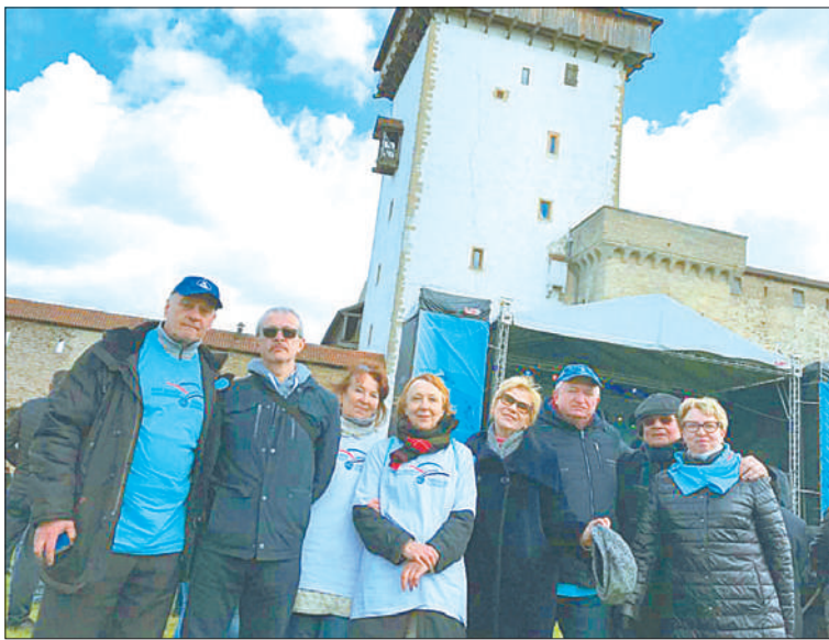
В делегацию от Санкт-Петербурга вошли члены редакционного совета газеты «Славянка сегодня».