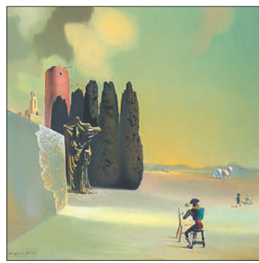
«Пейзаж с загадочными элементами», 1934