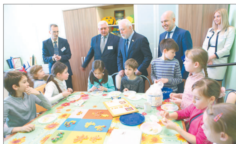
Посетителям Центров предлагается широкий спектр услуг – от занятий живописью до психологических мастер-классов.