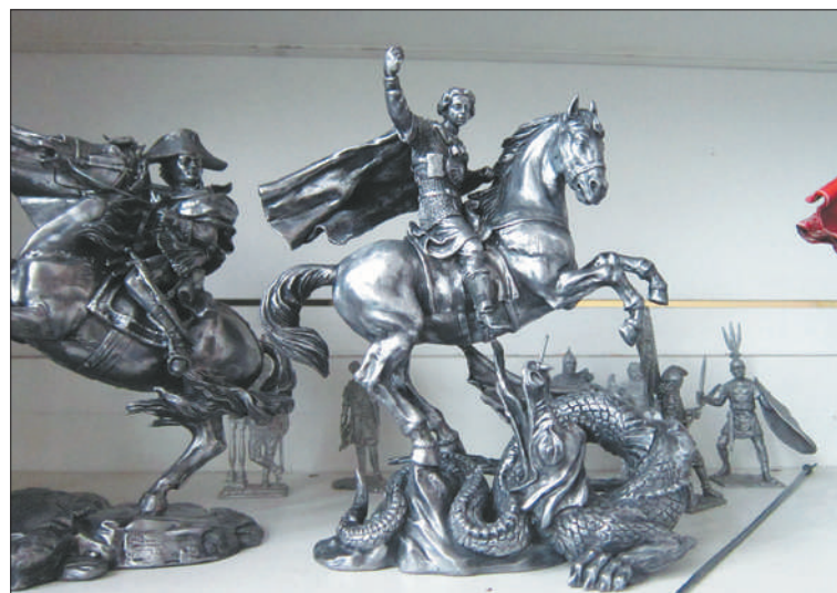
После выхода нового исторического фильма от коллекционеров поступают запросы на фигурки – даже из Австралии!

ЗАКАЗ ЭФФЕКТИВНОЙ РЕКЛАМЫ 958-59-05, 943-71-02 http://www.nslav.spb.ru/ , https://vk.com/club90376138