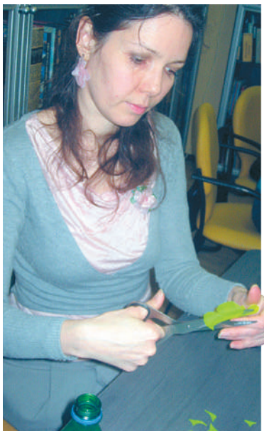
Всего через полчаса бутылки из-под минералки и газировки превратились в цветы.