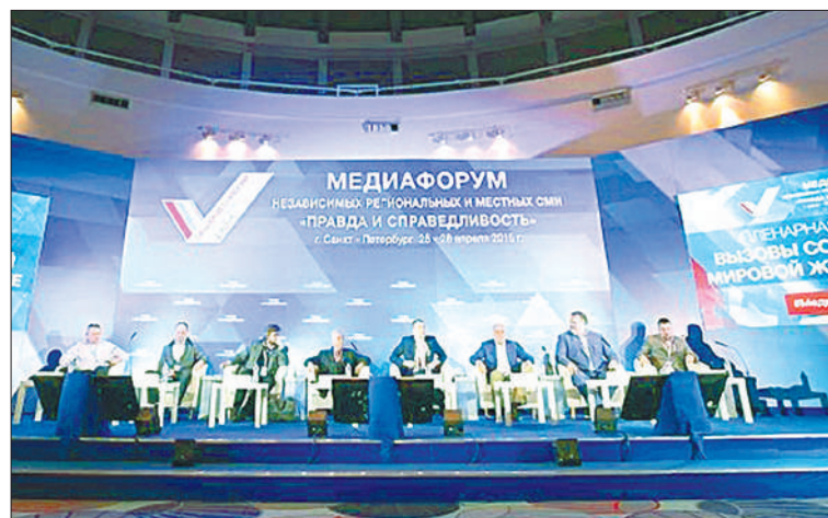
В работе Медиафорума приняли участие около 500 человек. «Журналисты, которые пишут о трудностях, о жизни своего района, – истинные патриоты», – уверены в ОНФ.