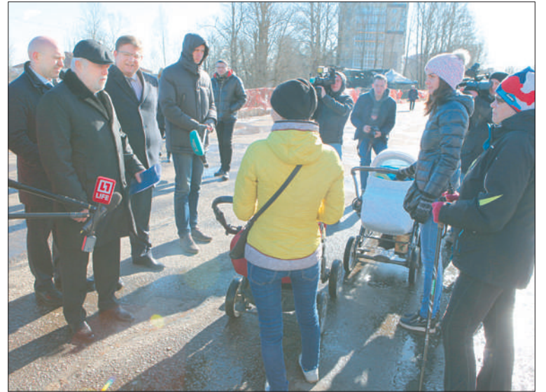
Жилье есть. Нужны дороги, школы, детские сады.

Еще одна горячая точка на карте района – Русановская улица. Два микроавтобуса – с членами комиссии и журналистами с трудом нашли место, чтобы