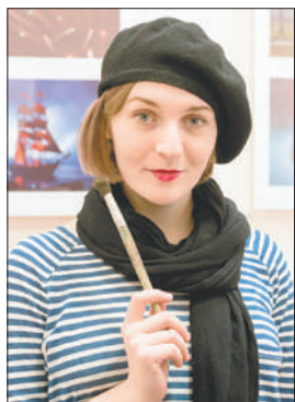
Посетители мастерской серьезно подошли к художественному перевоплощению.

Знакомый кабинет превратился в мастерскую на Монмартре. С экрана монитора улыбались натурщики, а художники старались выполнить портрет в той манере, которая была свойственна великим мастерам.