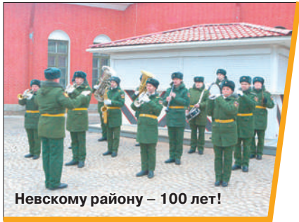
Невскому району – 100 лет!