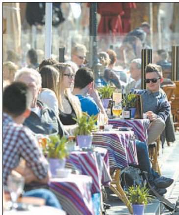
Теперь можно выпить чашечку кофе и почувствовать его аромат, а не запах сигаретного дыма.

Вообще, антитабачная концепция России – довольно жесткий документ. В нем, например, предлагается увеличить рабочий день для курильщиков: мол, из-за «перекуров» они трудятся