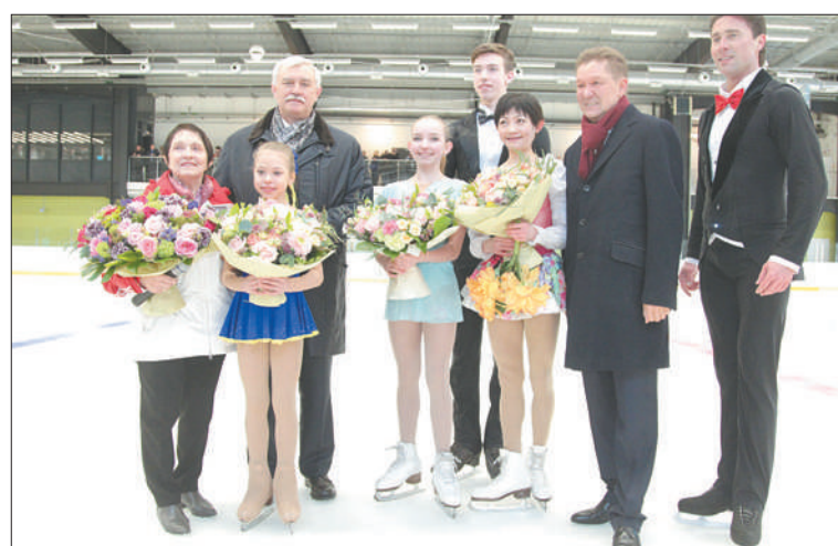
Алексей Миллер подтвердил, что программа «Газпром – детям» будет продолжаться, в том числе и в Петербурге.

Здесь разместились две ледовые арены – для хоккеистов и фигуристов. Планируется открытие Школы фигурного катания «Звездный лед» Тамары Москвиной. Во время массовых катаний каждая ледовая арена сможет принять за смену до 240 человек. Комплекс открыт для всех желающих.