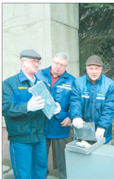
«Через года доносится к вам, люди XXI века, голос первостроителей новой жизни, творцов лучших советских дизелей...»

Полвека назад рабочие завода «Звезда» оставили «капсулу времени» с письмом для потомков. Открыли ее уже в новом тысячелетии – 15 марта 2017 года, когда старейшему предприятию по выпуску дизелей исполнилось 85 лет. Корреспондент «Славянки» присутствовал при историческом событии.