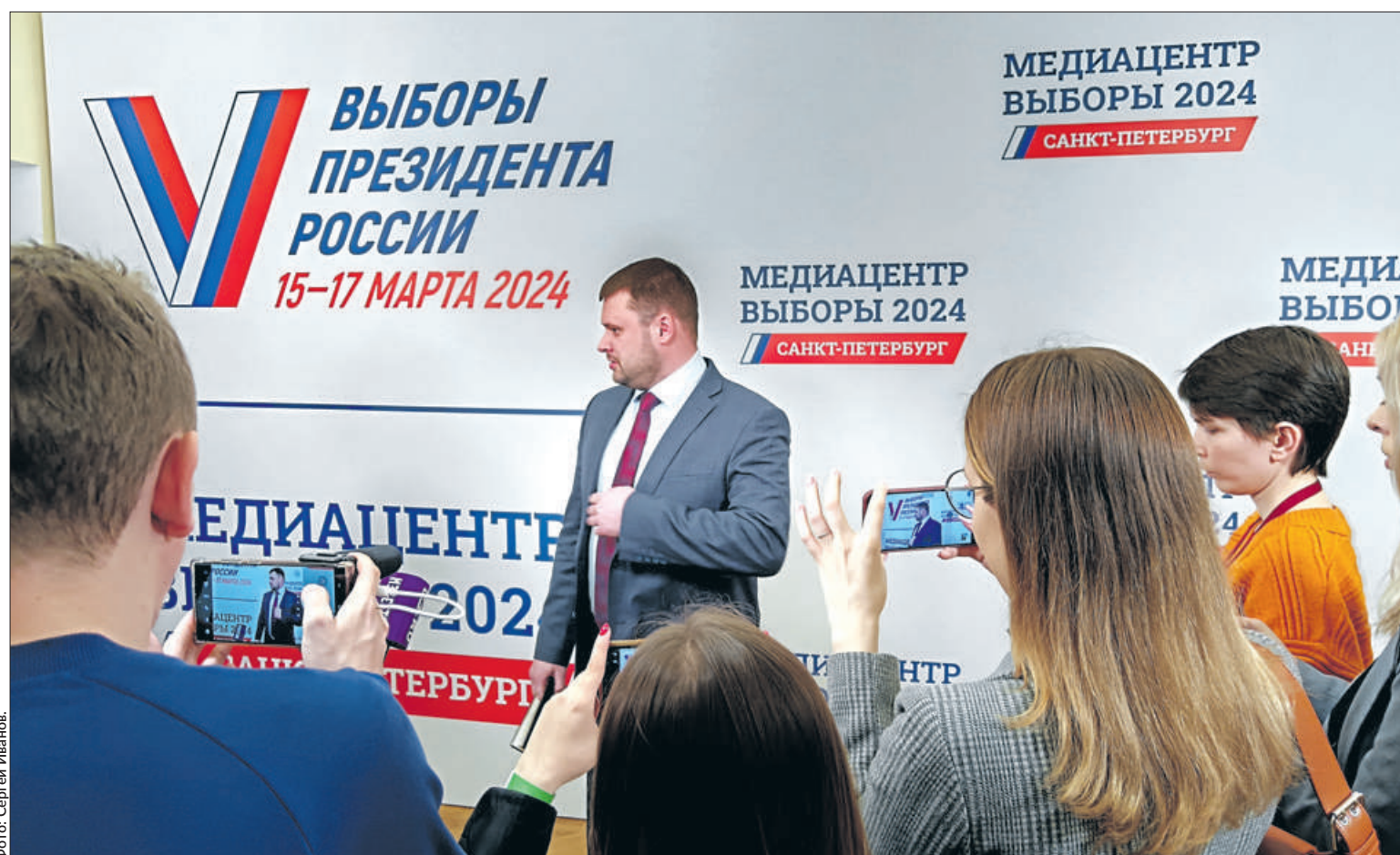
Четыре дня в Доме журналиста на Невском, 70 работал медиациентр, в котором регулярно проходили брифинги Санкт-Петербургской избирательной комиссии, информировавшей о ходе голосования и решении возникающих на участках технических проблем.

За счёт каких муниципалитетов наш район вырвался в городские лидеры по активности горожан? Наибольшая явка избирателей была в Рыбацком, МО Народном и Невском округе – более 80%. Наименее активны были избиратели в МО Оккервиль и МО 54. Больше всего поддержку Владимир Путин получил в МО Рыбацкое – 84,93%, МО Народный – 83,79%, в Невском округе – 82,92% и МО Правобережный – 81,7%. Занявший в Петербурге второе место Владислав Даванков получил 10,03% голосов в МО Оккервиль, 7,59% в МО 54 и 7,36% на территории муниципалитетов Невская застава, Обуховский и Ивановский. У Леонида Слуц-