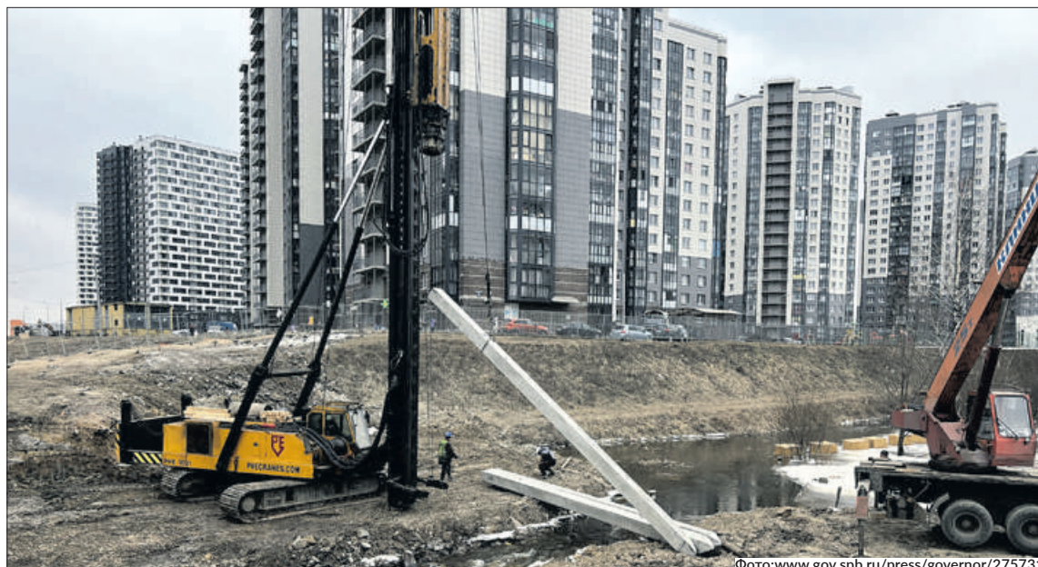
Завершить основные строительно-монтажные работы и открыть рабочее движение по Русановской улице планируется в этом году.

На примыкании Русановской улицы к Октябрьской набережной переустроены сети водопр-