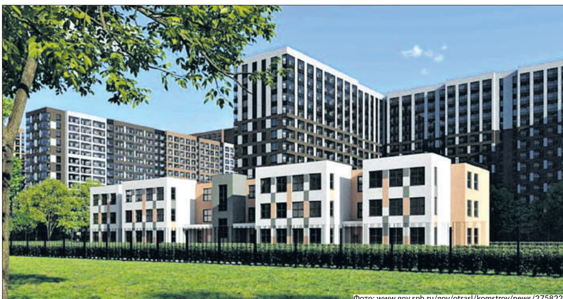
Вести детский сад в эксплуатацию застройщик планирует во II квартале 2025 года.