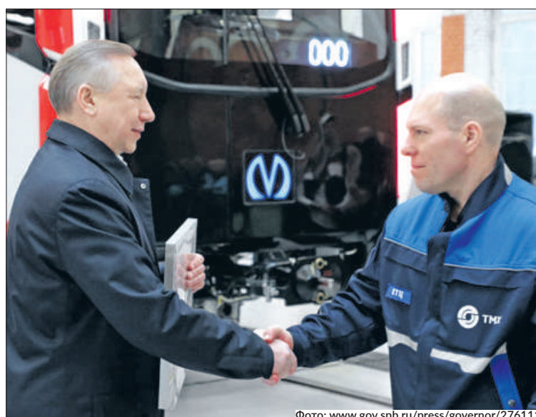
Александр Беглов поблагодарил работников завода за труд на благо родного города.