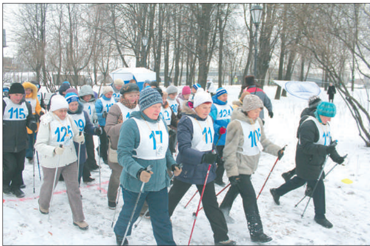
На базе парков Есенина и «Куракина дача» открыты группы для занятий скандинавской ходьбой. Они доступны для жителей района любого возраста, но особой популярностью пользуются у пожилых людей.

С 1 января дан зеленый свет для сдачи тестов ГТО. «Из со-