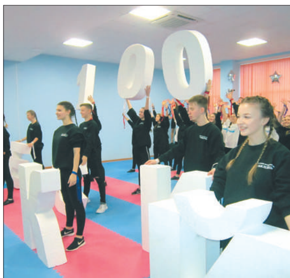
Гостей встречали праздничным флешмобом.