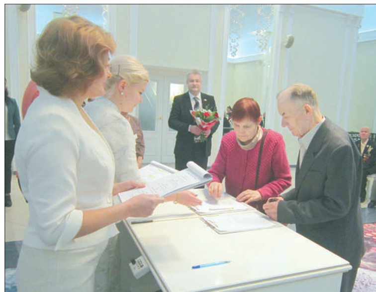
Юбилярам все желали здоровья, потому что самое драгоценное у них уже есть – любовь, над которой не властно время.