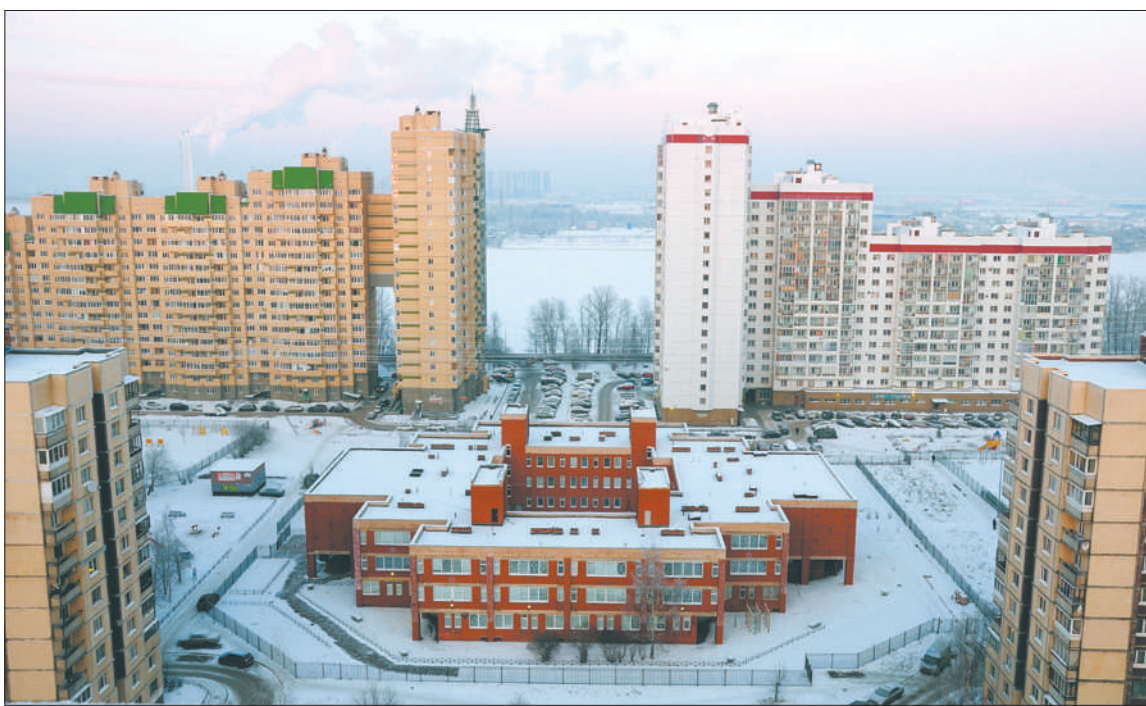
Району удалось решить проблему интенсивной застройки – строительство новых кварталов сопровождается развитием социальной инфраструктуры.

Столетие Невского района отметим не только праздничными концертами и торжественным выстрелом пушки с Нарышкина бастиона Петропавловской крепости, но и открытием новых спортивных школ, клубов, бассейнов.