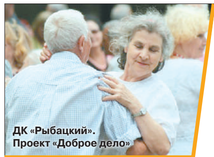
ДК «Рыбацкий». Проект «Доброе дело»