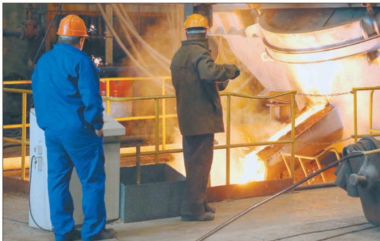
В минувшем году Невский завод выпустил новую турбину и заключил контракт с «Газпромом» на изготовление аппаратов для газопровода «Сила Сибири».

Императорский фарфоровый завод на 30% увеличил доход от экспорта, а в конкурсе «100 лучших товаров России» предприятие полу-