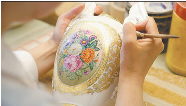
Императорский фарфоровый завод в конкурсе «100 лучших товаров России» получил награду «Гордость Отечества».

Одним из вариантов получения дополнительного дохода района могут стать мероприятия для туристов: экскурсии на производственные площадки, в заводские музеи. Это особенно актуально в год 100-летия Невского района.