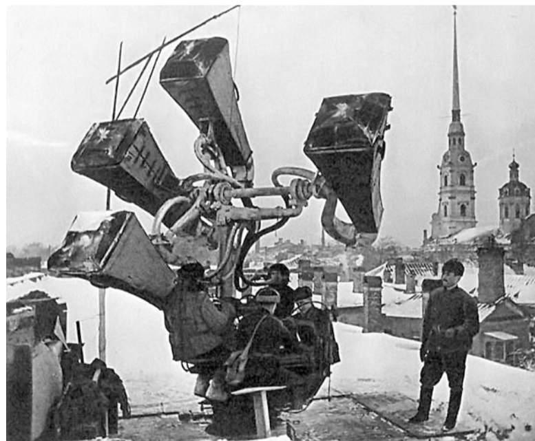
Мало кому известен подвиг 12 «слушачей». В 1942 году инвалиды по зрению записались в противовоздушные войска Красной армии, где с помощью специальных акустических аппаратов прослушивали ночное небо над городом.