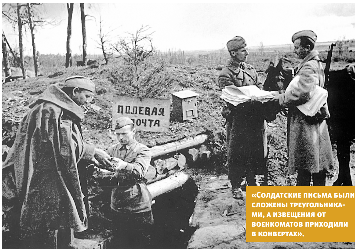
«СОЛДАТСКИЕ ПИСЬМА БЫЛИ СЛОЖЕНЫ ТРЕУГОЛЬНИКАМИ, А ИЗВЕЩЕНИЯ ОТ ВОЕНКОМАТОВ ПРИХОДИЛИ В КОНВЕРТАХ».