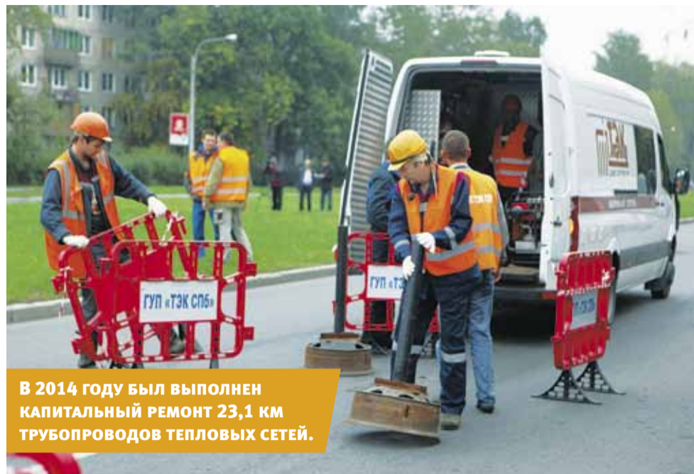
В 2014 году был выполнен капитальный ремонт 23,1 км трубопроводов тепловых сетей.

патриотической акции «Георгиевская ленточка», «Невский парад» 9 мая и многие другие, вызвали большой интерес у ветеранов, подростков и молодежи, а также положительный резонанс у жителей Невского района.