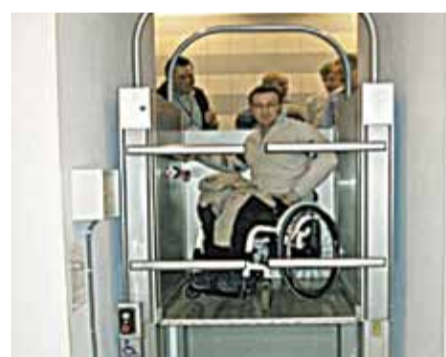
Бассейн «Атлантика», пр. Обуховской Обороны, 301

Во исполнение Федерального закона № 181-ФЗ от 24.11.1995 «О социальной защите инвалидов в Российской Федерации», распоряжения Правительства Санкт-Петербурга от 23 июля 2013 года № 52-рп «О Программе "Создание доступной среды жизнедеятельности для инвалидов в Санкт-Петербурге на 2013–2015 годы"», в