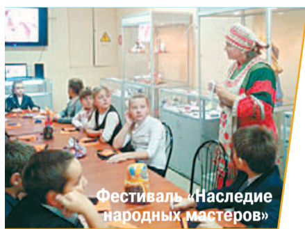
Фестиваль «Наследие народных мастеров»