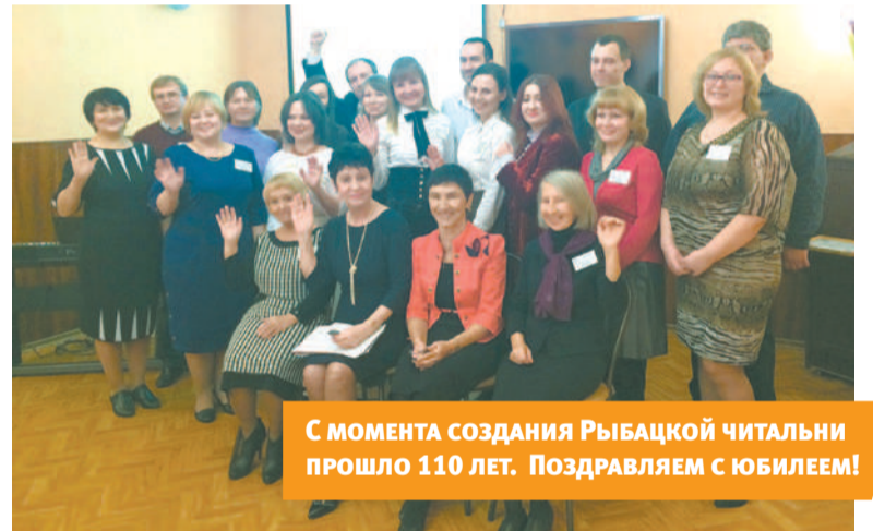
С момента создания Рыбацкой читальни прошло 110 лет. Поздравляем с юбилеем!

После того как Рыбацкое отметит свое трехсотлетие, можно будет и в Фонд Лихачева написать, рассказать им, что же такое – новое краеведение!