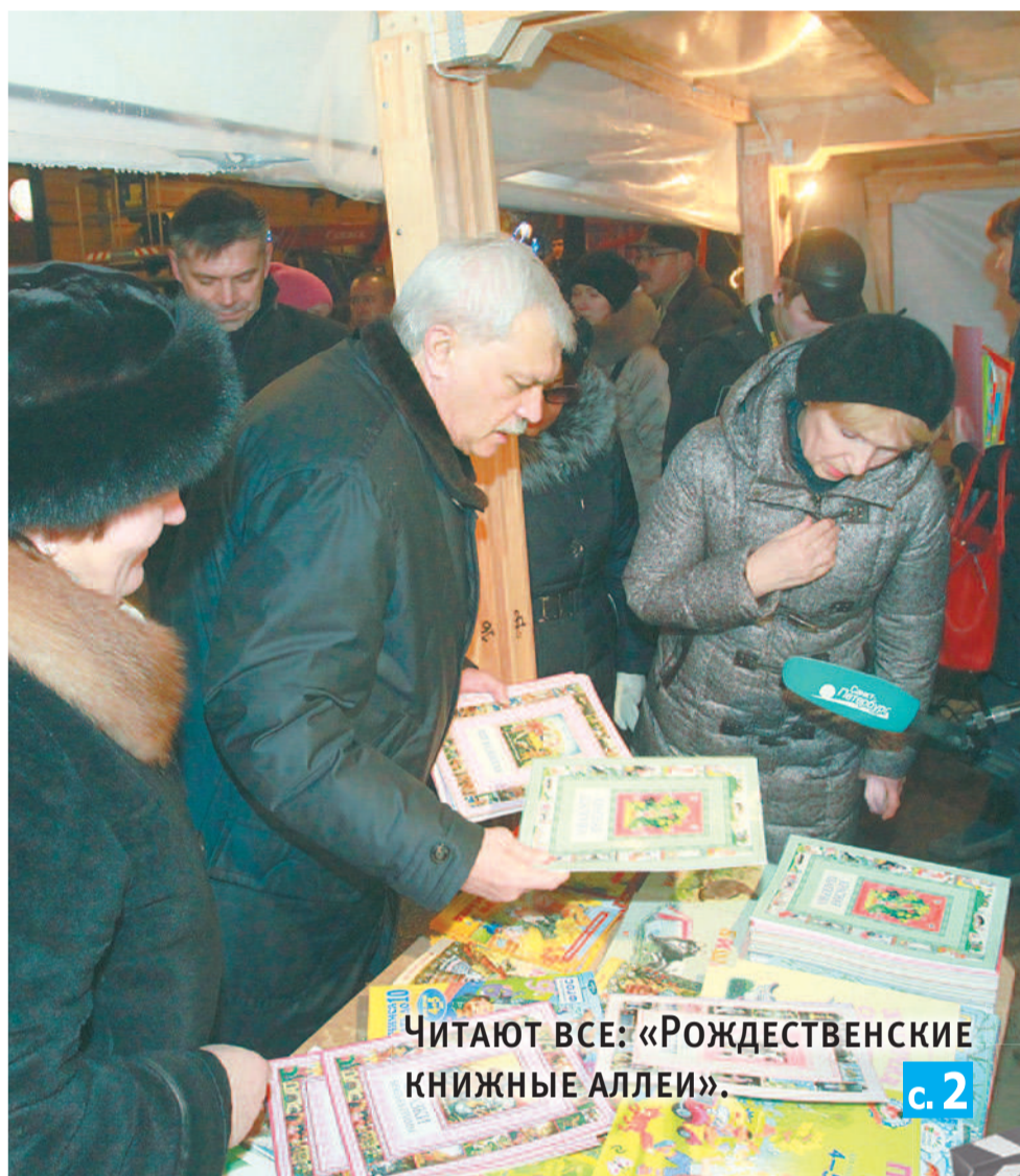
Читают все: «РОЖДЕСТВЕНСКИЕ КНИЖНЫЕ АЛЛЕИ».

школьников участвовали в фестивале «Наследие народных мастеров» в ДК «Рыбацкий».