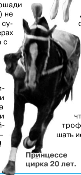
Принцесса цирка 20 лет.

Приходите в музей, чтобы полюбоваться на трофейную куклу и послушать историю ее удивительной хозяйки. А потом непременно загляните в цирк!