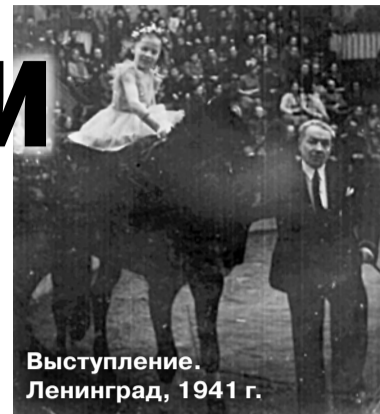
Выступление. Ленинград, 1941 г.

кой и принесла этого медведя, сказав: «Пусть он теперь у вас живет».