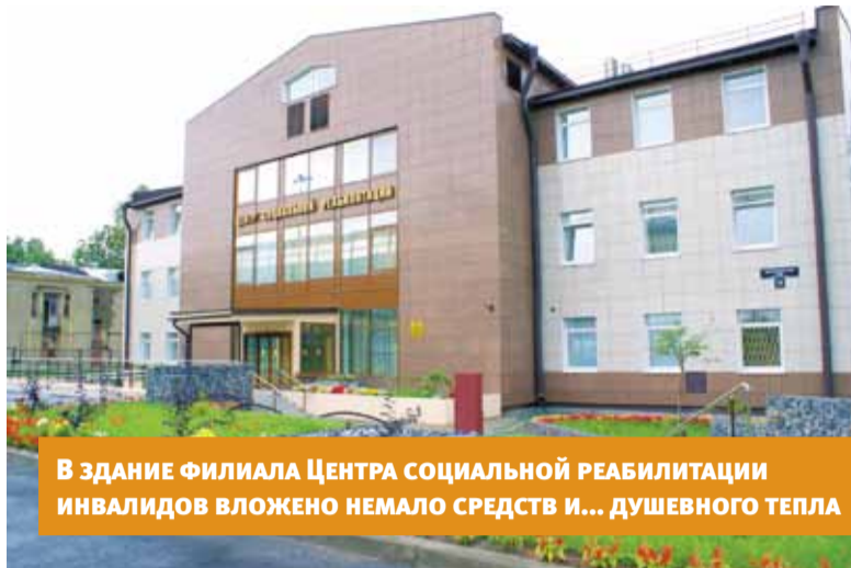
В здании филиала Центра социальной реабилитации инвалидов вложено немало средств и... душевного тепла

В здании на Запорожской улице вложено немало средств и... душевного тепла. Это проявляется даже в мелочах. Например, при помощи фактурной штукатурки один этаж стал «морским», дру-