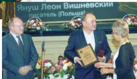
Польский писатель Януш Леон Вишневский с дипломом лауреата.

енном 1944-м. «Я был типичным ленинградским ребенком, – вспоминает народный артист России, – хлебнул блокадной доли...» По его словам, «Балтийская звезда» – очень петербургская награда. В благодарность он подарил организаторам и гостям церемонии выступление своего коллектива. Эрмитажный театр зазвенел от чистейших голосов,