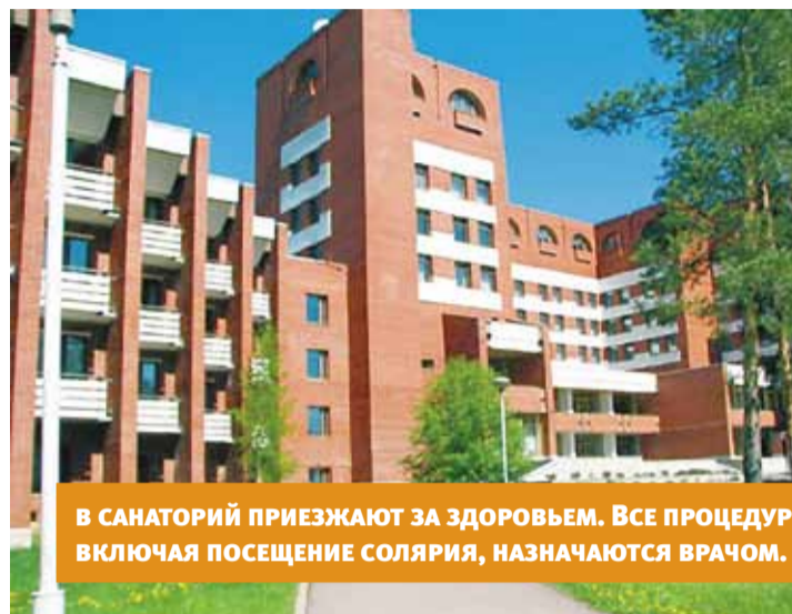
В САНАТОРИИ ПРИЕЗЖАЮТ ЗА ЗДОРОВЬЕМ. ВСЕ ПРОЦЕДУРЫ, ВКЛЮЧАЯ ПОСЕЩЕНИЕ СОЛЯРИЯ, НАЗНАЧАЮТСЯ ВРАЧОМ.

Конечно, в Курортном районе «Белые ночи» не единственный санаторий, но один из лучших. На XV Всероссийском форуме