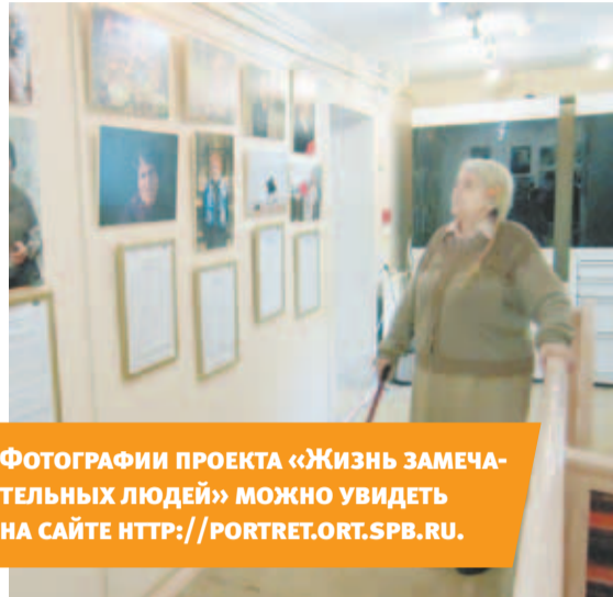
ФОТОГРАФИИ ПРОЕКТА «ЖИЗНЬ ЗАМЕЧАТЕЛЬНЫХ ЛЮДЕЙ» МОЖНО УВИДЕТЬ НА САЙТЕ HTTP://PORTRET.ORT.SPB.RU .