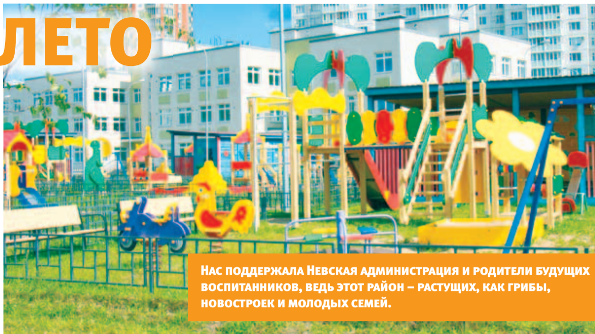
НАС ПОДДЕРЖАЛА НЕВСКАЯ АДМИНИСТРАЦИЯ И РОДИТЕЛИ БУДУЩИХ ВОСПИТАННИКОВ, ВЕДЬ ЭТОТ РАЙОН – РАСТУЩИХ, КАК ГРИБЫ, НОВОСТРОЕК И МОЛОДЫХ СЕМЕЙ.

Детсад № 35 является районной инновационной экспериментальной площадкой: здесь ищут оптимальные способы для социализации и индивидуализа-