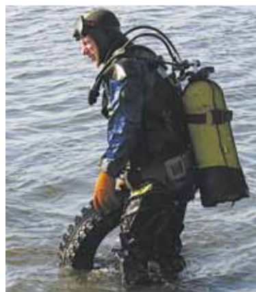
К уборке карьера привлекли профессиональных водолазов.