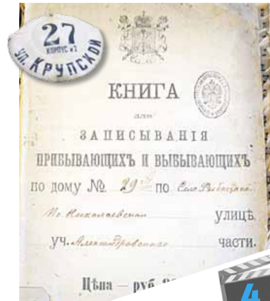
Новые экспонаты в музее «Невская застава»