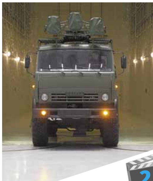
Броня крепка: кто создает оборонный щит родины?