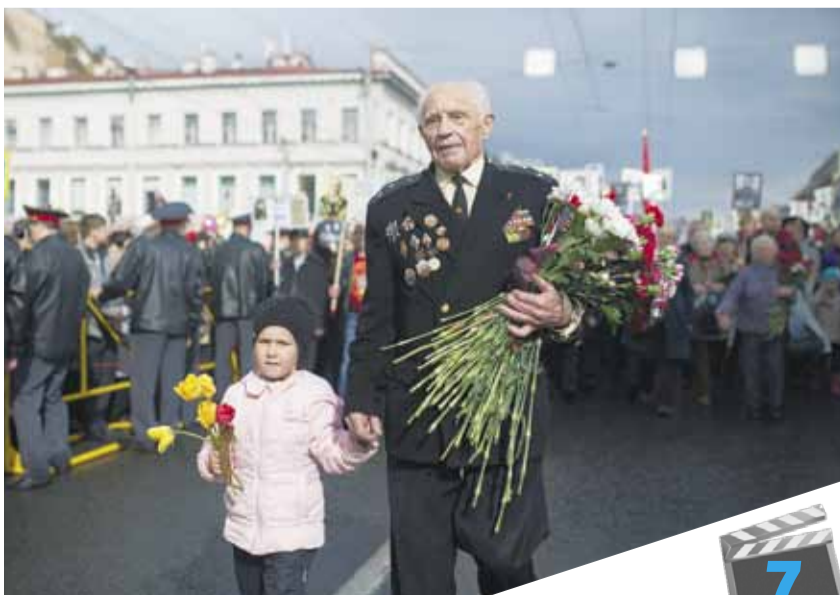
Молодежь фотографирует ветеранов: выставка «Победа в сердце каждого живет»