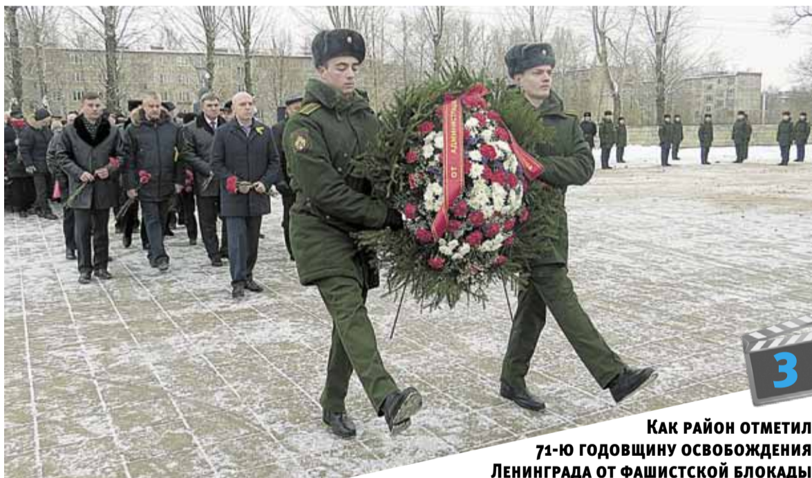
КАК РАЙОН ОТМЕТИЛ 71-Ю ГОДОВЩИНУ ОСВОБОЖДЕНИЯ ЛЕНИНГРАДА ОТ ФАШИСТСКОЙ БЛОКАДЫ