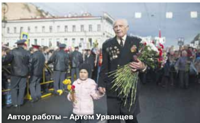
Автор работы – Артем Урванцев