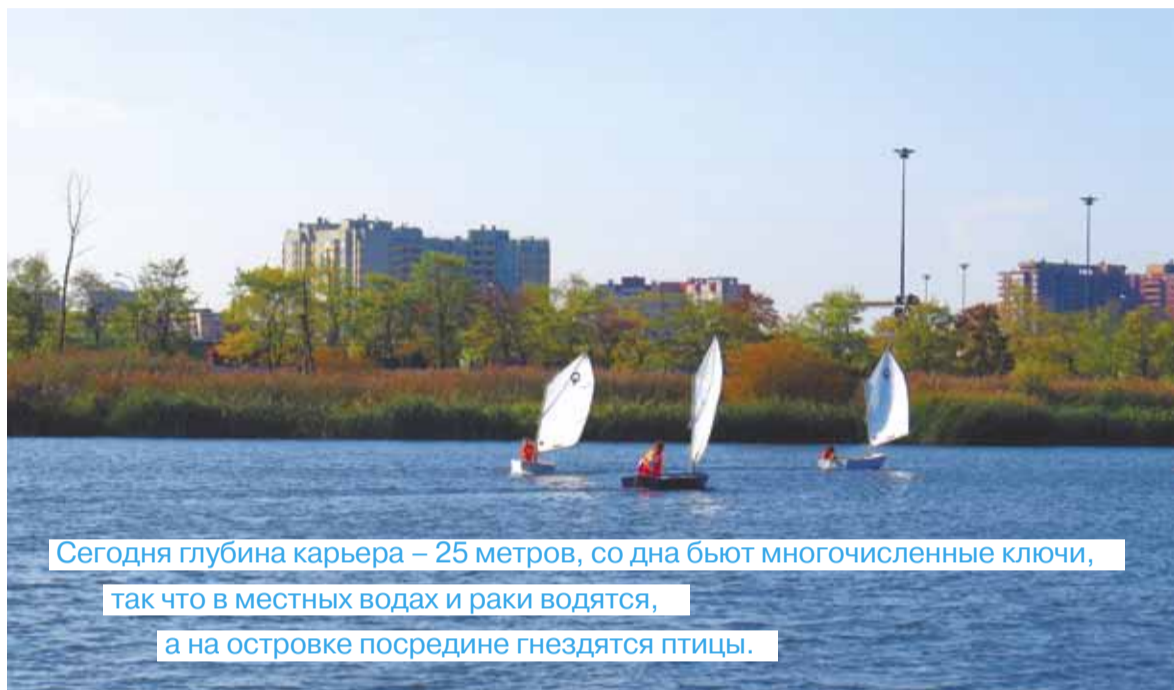
Сегодня глубина карьера – 25 метров, со дна бьют многочисленные ключи, так что в местных водах и раки водятся, а на островке посередине гнездятся птицы.