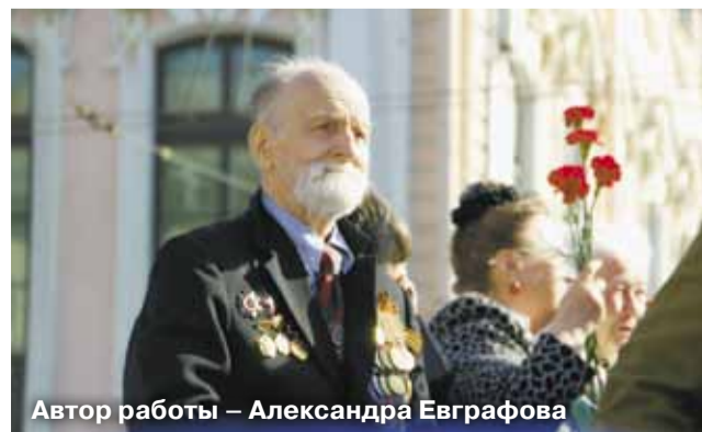
Автор работы – Александра Евграфова