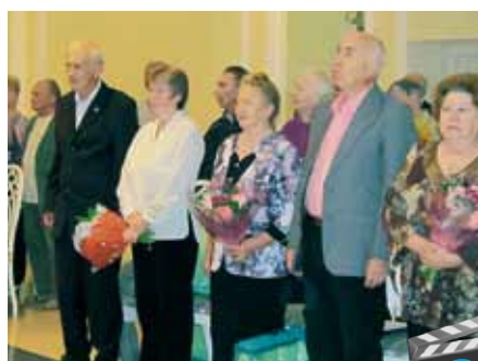
Совет да любовь: чествуем чемпионов семейной жизни