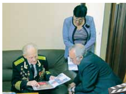
Друзья-однополчане: встреча через 70 лет