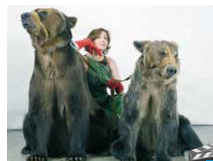
Как стать дрессировщиком: история циркового артиста