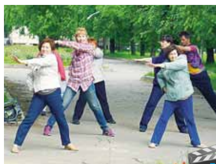
Будьте здоровы: гимнастика на свежем воздухе