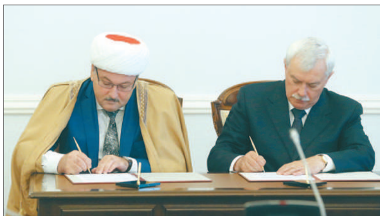
Межнациональное согласие и спокойствие были отличительной чертой Петербурга на протяжении всей его истории.

Губернатор поблагодарил муфтия за работу по социокультурной адаптации мигрантов, которая проводится в Санкт-Петербургской соборной мечети, и отметил, что мигранты «приезжают в Петербург с добрыми намерениями, чтобы работать, и укрепляют экономику города». «Это хорошие инициативы, мы их будем поддерживать», – отметил глава города. Он также одобрително отозвался о проведении в Петербурге конференции по передаче опыта мировых традиционных религиозных организаций в борьбе с терроризмом, ини-