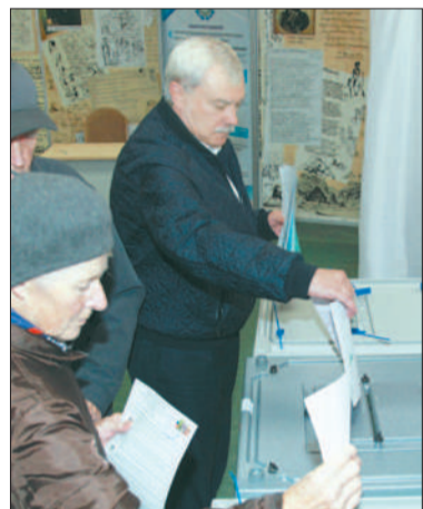
Губернатор Георгий Полтавченко проголосовал на избирательном участке № 1659, расположенном в Академической гимназии № 56.