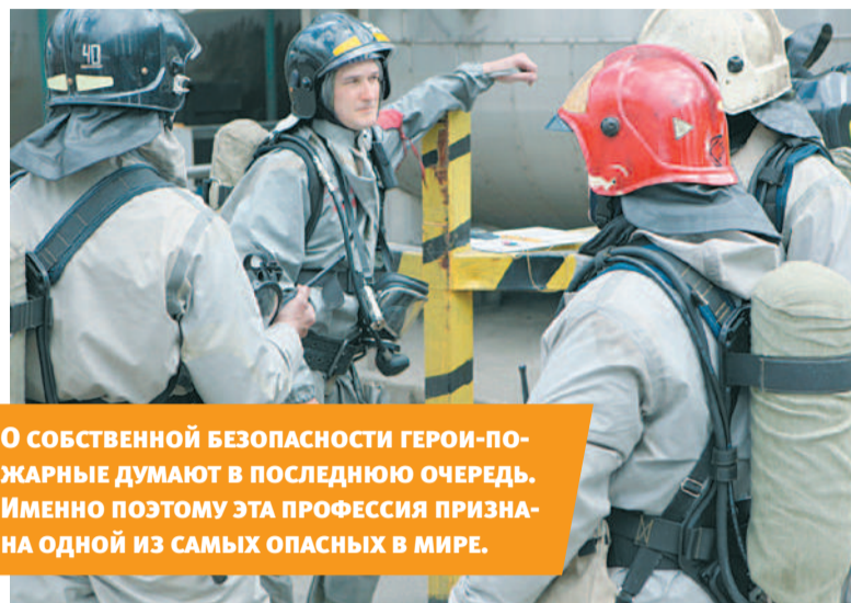
О СОБСТВЕННОЙ БЕЗОПАСНОСТИ ГЕРОИ-ПОЖАРНЫЕ ДУМАЮТ В ПОСЛЕДНЮЮ ОЧЕРЕДЬ. ИМЕННО ПОЭТОМУ ЭТА ПРОФЕССИЯ ПРИЗНАНА ОДНОЙ ИЗ САМЫХ ОПАСНЫХ В МИРЕ.

Шли годы. Менялось техническое оснащение пожарных, на смену конным ходам пришли автомобили, бдительный дозорный на каланче уступает место сигнализации и телефонным проводам. Сегодня в арсенале огнеборцев – мощная