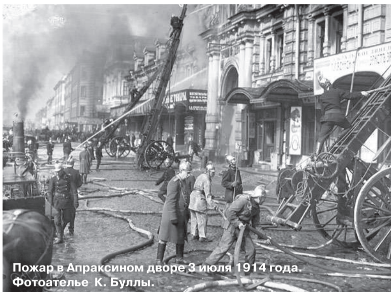
Пожар в Апраксином дворе 3 июля 1914 года.

Территориальный отдел по Невскому району УГЗ ГУ МЧС России по Санкт-Петербургу