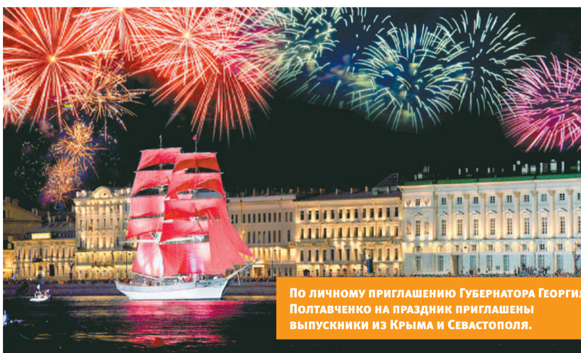
По личному приглашению Губернатора Георгия Полтавченко на праздник приглашены выпускники из Крыма и Севастополя.