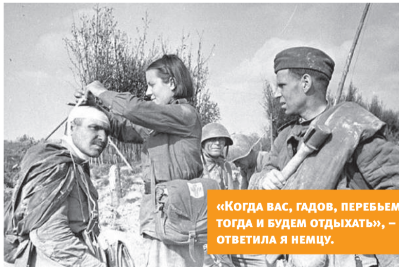
«КОГДА ВАС, ГАДОВ, ПЕРЕБЬЕМ, ТОГДА И БУДЕМ ОТДЫХАТЬ», – ОТВЕТИЛА Я НЕМЦУ.