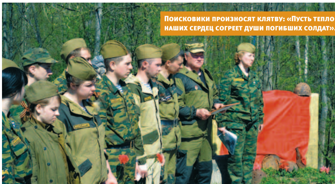
Поисковики произносят клятву: «Пусть тепло наших сердец согреет души погибших солдат».

В этом году, по уже сложившейся традиции, 43 человека с двадцатых чисел апреля по седьмое мая стояли лагерем в урочище. Участники тамбовской экспедиции в рамках Всероссий-