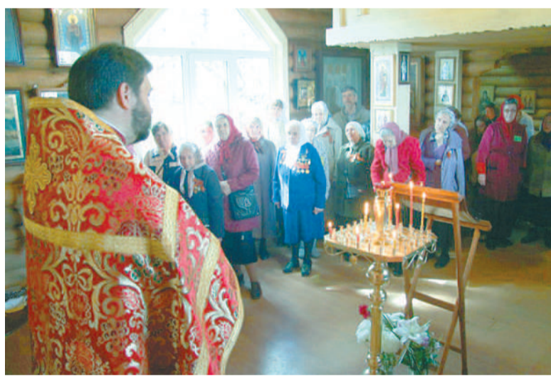
Праздничная литургия 9 Мая.

В Приходском доме № 12 по Рыбацкому проспекту ремонт – воскресная школа отправилась