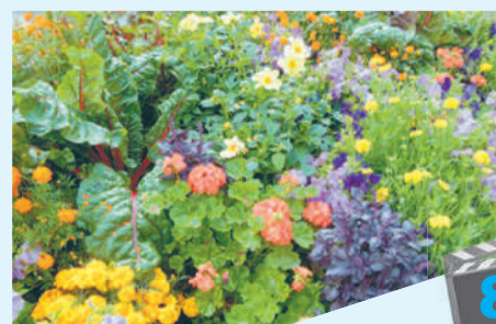
ВСЕМ МИРОМ: ПРИМИТЕ УЧАСТИЕ В АКЦИИ ЦРБ ИМ. СОБОЛЕВА «ЗЕЛЕНАЯ КЛУМБА».