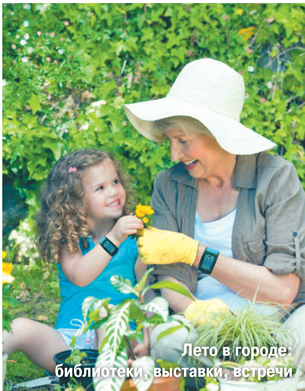
Лето в городе: библиотеки, выставки, встречи

ДАТА: ДЕНЬ ПАМЯТИ И СКОРБИ ОБЪЕДИНИЛ ГОРОЖАН.