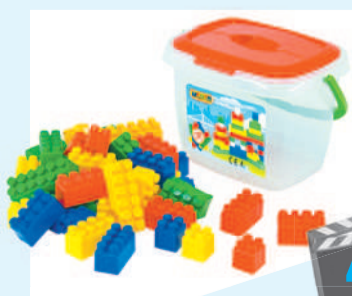
БЛАГОЕ ДЕЛО: ПРИСОЕДИНЯЙТЕСЬ К БЛАГОТВОРИТЕЛЬНОЙ АКЦИИ «ДОБРОЕ СЕРДЦЕ».