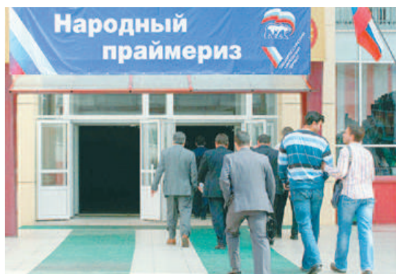
Участие в предварительном голосовании в 211-м округе приняли более 11,77% избирателей.

«Единая Россия» подводит итоги предварительного голосования.