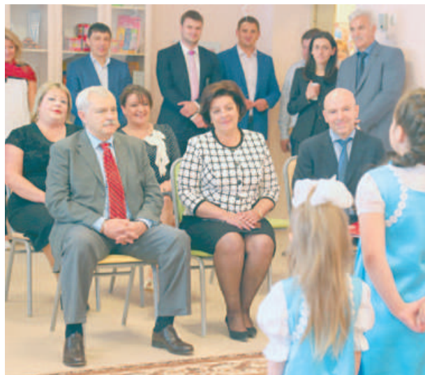
Гости побывали на концерте, подготовленном воспитанниками детского сада.

Новый детский сад полностью соответствует современным требованиям к дошкольному образовательному учреждению. Губернатор посмотрел площадки для прогулок, групповые и спальные комнаты, спортивный зал, помещения для занятий творчеством и бассейн. Как отметила председатель Комитета по образованию