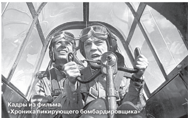
Кадры из фильма «Хроника пикирующего бомбардировщика»

«Однажды я исполнил песню «Туман» в авиационном полку. На сцену неожиданно вышел человек с тремя Звездами Героя на груди! Это был знаменитый Иван Кожедуб — наш ас. Он сказал: «Саня, ты написал правдивую песню!»