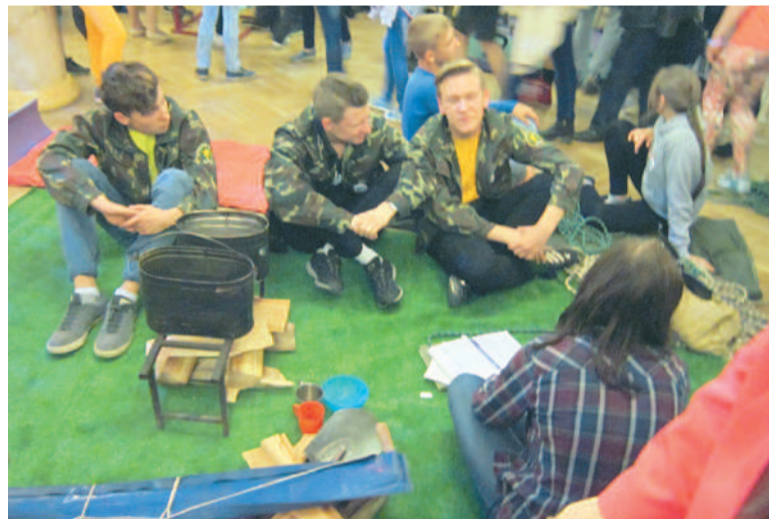
Романтика девяностых – походы и песни у костра...