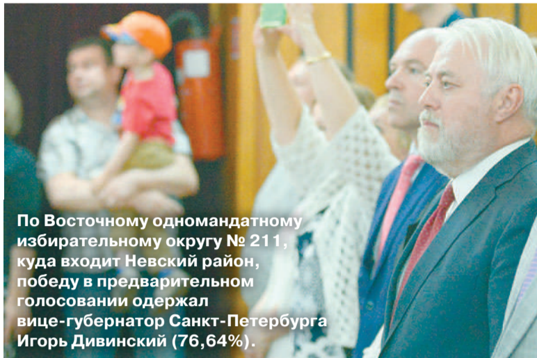
По Восточному одномандатному избирательному округу № 211, куда входит Невский район, победу в предварительном голосовании одержал вице-губернатор Санкт-Петербурга Игорь Дивинский (76,64%).

По результатам голосования 180 тысяч петербуржцев (явка 4,7%), лидерами по городскому общефедеральному округу по выборам в Госдуму стали: