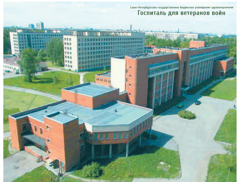
Санкт-Петербургское государственное бюджетное учреждение здравоохранения Госпиталь для ветеранов войн

– Госпиталь оказывает как неотложную, так и плановую медицинскую помощь?