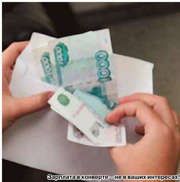
Зарплата в конверте – не в ваших интересах!

– Состояние трудовой книжки. Часто получается, что где-то не поставлена подпись, где-то нет печати, так что будущему пенсионеру приходится тратить время на получение справок, подтверждающих, что он работал там-то и там-то, в такое-то время. Чтобы избежать этих проблем непосредственно в момент оформления пенсии (напомню, заявление подается за месяц до предполагаемого выхода на пенсию по возрасту), нужно заблаговременно, месяцев за 6-7, обратиться к нашим консультантам. Они проверят имеющиеся документы, скажут, какие будут необходимы еще, и так далее. Сразу скажу, что расчетом пенсий мы занимаемся при помощи компьютерной программы, поэтому заранее консультант