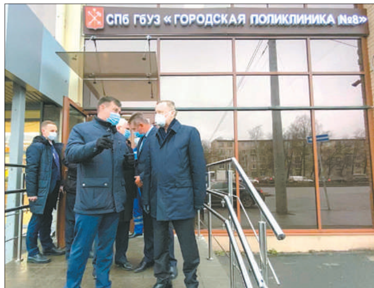
Сдача объекта в срок на личном контроле у губернатора и главы района.

«Поликлиника № 8 Невского района обслуживает почти 400 тысяч детей и взрослых.