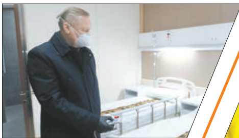
ПОД КОНТРОЛЕМ ГУБЕРНАТОРА