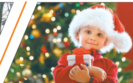
СОЗДАЁМ НОВОГОДНЕЕ НАСТРОЕНИЕ