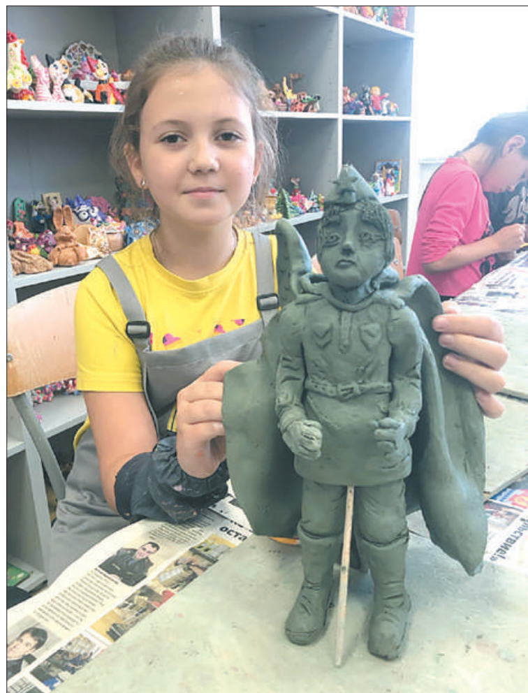
В этом году конкурс юных скульпторов имени Михаила Аникушина посвящён 75-летию Победы.