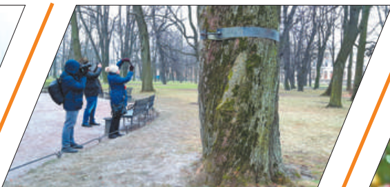
СОСТАВЛЯЕМ КАРТУ ДЕРЕВЬЕВ НЕВСКОГО РАЙОНА