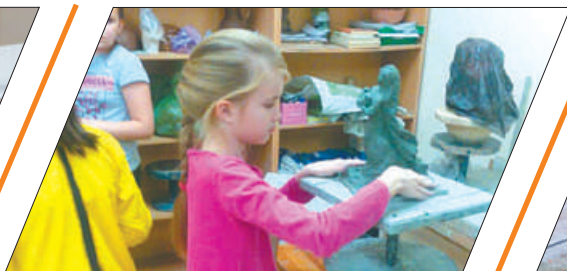
КОНКУРС АНИКУШИНА НАХОДИТ ТАЛАНТЫ