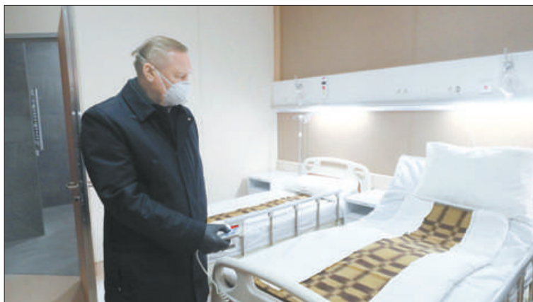
«После открытия госпиталь будет переоборудован в инфекционную больницу с коечным фондом на 405 мест», – отметил губернатор.

На новые помещения станции получено положительное санитарно-эпидемиологическое заключение. Все необходимые документы направлены в Лицензионное управление Комитета по здравоохранению. В первой половине декабря ожидается получение лицензии. Это позволит открыть отделение «скорой помощи» в начале 2021 года.