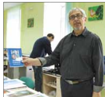
В типографии можно освоить новую профессию.

Уже четыре года действует социальная программа «Создание модели социально-трудоустройства инвалидов, испытывающих трудности в трудоустройстве», в Санкт-Петербургском государственном бюджетном учреждении социальной защиты населения «Центр социальной реабилитации инвалидов и детей-инвалидов Невского района