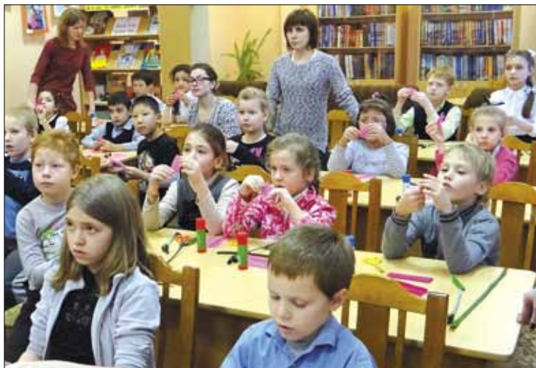
По заявке администрации школы-интерната библиотекари проводят мероприятия на площадках школы.

Ежегодно, начиная с 2012 года, в декабре в библиотеке проходит большой праздник книги и