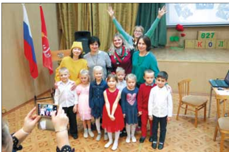
Отдельно хочется отметить выступление маленьких талантов хоровой группы детского сада № 90 и театральной студии «Улыбка» 627-й школы.

Сотрудники библиотеки показали ребятам множество книг