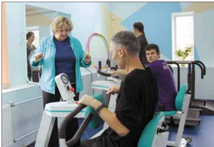
Для каждого посетителя подобран свой комплекс упражнений на тренажёрах.