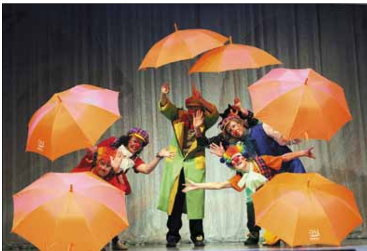
В Центре работают студии – театральная, музыкальная, прикладного творчества.