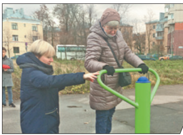
ПЛОЩАДКА ЗДОРОВЬЯ ДЛЯ ПОЖИЛЫХ