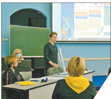
Всего жюри рассмотрело 19 работ.

Образовательные учреждения Невского района стали победителями конкурса лучших практик реализации программ наставничества «Вперёд и вместе». Участники боролись за лидерство в трёх номинациях: «Профессионал – профессионалу»; «Юные – юным»; «Взрослые – юным». Эксперты дали высокую оценку двум проектам из Невского района. Гимназия № 528 заняла 1-е место в номинации «Профессионал – профессионалу», 3-е место в этой же номинации присвоено средней общеобразовательной школе № 323.