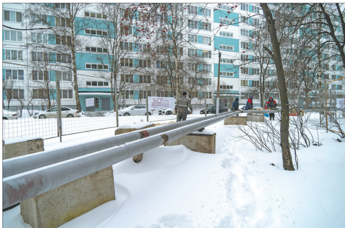
После завершения работ надёжное теплоснабжение получат 47 зданий.