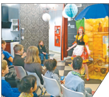
Спектакль «Волк и Красная Шапочка» подарил всем весёлое настроение.

Детская библиотека № 12 организовала и провела 2 декабря праздник «Добро без границ» в рамках Всероссийского фестиваля «Эстафета доброты-2021» для детей с ОВЗ. Мероприятие состоялось в Центре социальной реабилитации инвалидов и детей-инвалидов Невского района, отделении № 1. Ребята посмотрели спектакль «Волк и Красная Шапочка», сразились в настольные игры, получили призы и подарки.