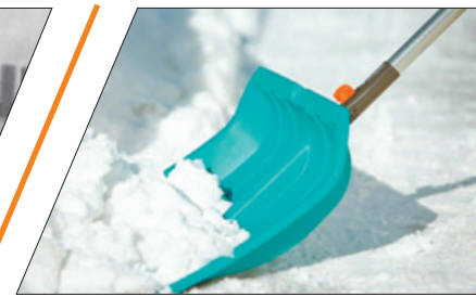
«ГОРЯЧАЯ ЛИНИЯ» ПО ВОПРОСАМ УБОРКИ СНЕГА