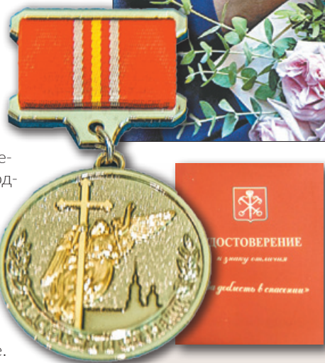
На знаке отличия – ангел. Его золотистая фигура изображена на шпигеле Петропавловского собора, на фоне силуэта Петропавловской крепости. Вы ни с чем не спутаете этот образ Петербурга – Петербурга сострадательного.