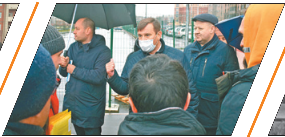
ПЯТЬ КИЛОМЕТРОВ ТЕПЛА