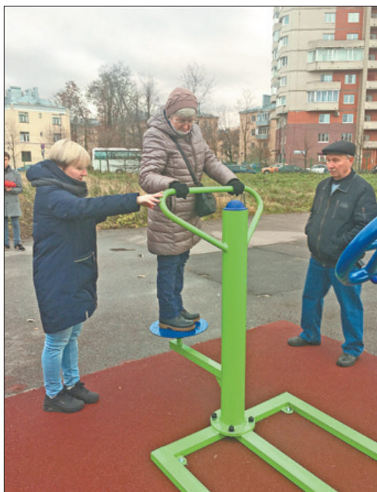
Новая площадка станет ядром креативного пространства на территории школы.

Рядом со школой № 327 появилась тренажёрная площадка для пожилых людей.