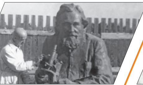
ПУТЬ СКУЛЬПТОРА: 83 ГОДА И 286 СТРАНИЦ