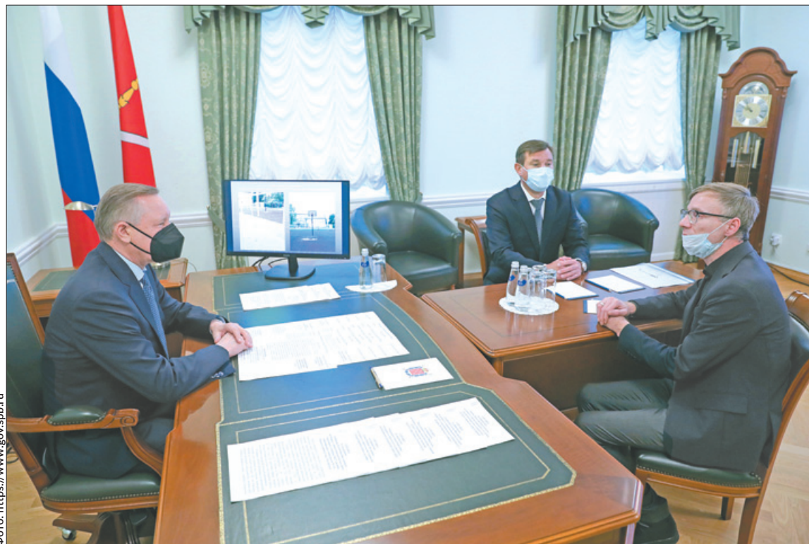
Житель Невского района обратился к губернатору с просьбой отремонтировать стадион при школе № 334.

Губернатор Александр Беглов провёл личный приём граждан в Смольном, по итогам которого дал ряд поручений. Так, житель Невского района обратился с просьбой отремонтировать спортивный стадион при школе № 334 на улице Шелгунова. Александр Беглов дал поручение провести работы до 25 августа 2022 года. «К новому учебному году приведём стадион в порядок, чтобы там могли заниматься и школь-