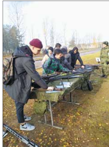
День призывника. Школьники Невского района в окружном учебном центре, посёлок Сертолово.

– Они могут выбрать: проходить службу по призыву в течение одного года или по контракту в течение двух лет. Одарённые студенты и выпускники попадают в научные роты. В Петербурге такие роты созданы при четырёх академиях – Военно-морской, Военно-медицинской, Академии тыла и транспорта имени Хрулева и Академии связи. С начала призыва уже два новобранца из Невского района направлены в Академию связи и Военно-медицинскую академию. Кандидатам в сборные команды России по олимпийским видам спорта также предоставлена возможность служить в специальных ротах. Одного призывника из нашего района уже командировали в спортроту в Москву.