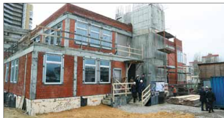
«Нерадивых подрядчиков с этого объекта мы убрали. Рассчитываю, что теперь работа пойдет быстрее и в следующем году садик сможет принять малышей», – заявил губернатор.