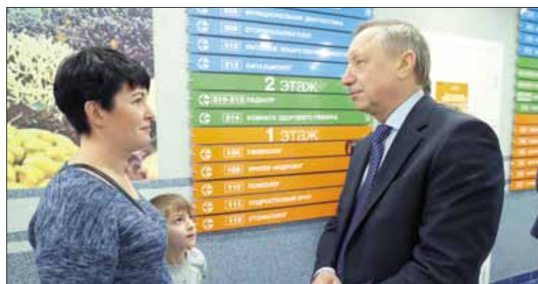
Количество маленьких пациентов в поликлинике превышает норму – она рассчитана на девять тысяч посетителей, но сейчас принимает около пятнадцати, причём не только из Невского района, но и из Кудрово.