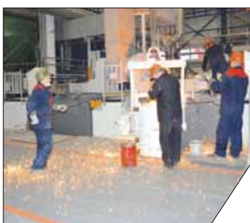
Демонстрация юбилейной отливки стали в новом корпусе Обуховского завода.

В честь 180-летия со дня рождения великого русского металлурга Дмитрия Чернова на Обуховском заводе состоялся ряд торжественных мероприятий: митинг с возложением цветов к памятнику Дмитрию Чернову, презентация книги «Д. К. Чернов. Взгляд сквозь время», открытие выставки, на которой представлены уникальные экспонаты, в том числе личные вещи этого выдающегося человека. Посетить выставку можно в часы работы музея: с понедельника по пятницу с 10.00 до 17.00.