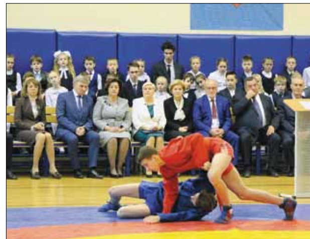
Воспитанники гимназии подготовили для почётных гостей показательные выступления.

История секции самбо в гимназии № 330 насчитывает уже 53 года. Здесь сложились прочные спортивные традиции. Оба действующих тренера – выпускники этого учрежде-