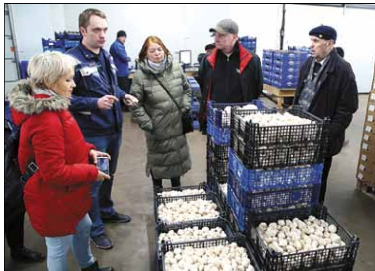
Эффективной работе предприятия помогает развитие шампиньонного комплекса и наличие современных оборудованных хранилищ продукции.