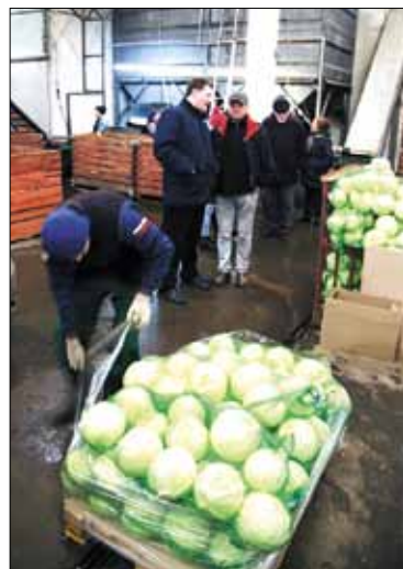
Многие инженерно-технические работники помнят осенние выезды «на капусту» и овощебазы в 80-е годы.

Символично, что в преддверии 75-летия Великой Победы рассматривается возможность возвращения на упаковку с продукцией предприятия, наравне с узнаваемым брендом «Приневское», названия «Красный Октябрь», – в честь подвига аграриев Ленинграда.