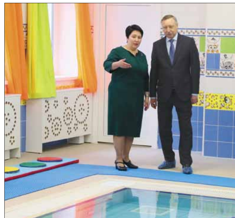
«Новые детские садики, так же как и школы, должны быть с бассейном. Это дорого стоит, но если мы не будем закладывать сейчас такие нормы, то потом никогда можем к ним не вернуться или сделаем это с опозданием», – сказал глава города.