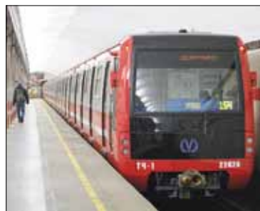
«Юбилейными» поезда этой серии названы в честь 60-летия Петербургского метрополитена, которое праздновалось в 2015 году.

Главная особенность современных поездов метро, которые производятся для петербургской подземки, – асинхронный тяговый привод, позволяющий, по сравнению с подвижным составом более ранних серий, экономить до 30% электроэнергии. При отделке салонов используются материалы, обеспечивающие повышенную стойкость к истиранию и полное удаление загрязнений, несанкционированных надписей и рекламы. Конструкция системы вентиляции обеспечивает равномерное распределение воздушного потока в пассажирском салоне. В головных вагонах предусмотрен электронный маршрутоуказатель. Кабина машиниста оснащена современным пультом управления с цветным сенсорным дисплеем, кон-