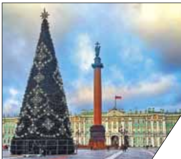
Всего к праздникам в городе установят 61 искусственную ель.

Власти города в 2020 году планируют провести интернет-голосование, в котором предложат жителям решить, нужно ли заменять искусственную новогоднюю ёлку, которая устанавливается в центре, на настоящую. Впервые главная ель на Дворцовой площади стала искусственной в 2013 году – так решили горожане в результате интерактивного голосования. Высота дерева – 25 метров, в этом году она вновь станет главным новогодним украшением города.