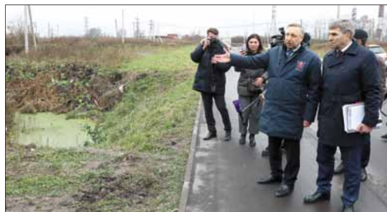
Губернатор дал указание ликвидировать несанкционированную свалку в районе Приневской улицы.