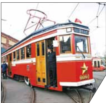
Внутри трамвай оснащён самым современным оборудованием.

Регулярный туристический маршрут ретро-трамвая открыли в Санкт-Петербурге. Для перевозки пассажиров создали аналог легендарного вагона «Американка», который эксплуатировался в городе с довоенного времени и до 1979 года. Каждый день ретро-трамвай будет проходить через шесть мостов и 500 достопримечательностей. Пассажиры трамвая смогут увидеть легендарный крейсер «Аврора», Михайловский замок, Петропавловскую крепость, а также Ленинградский зоопарк, Марсово поле и Летний сад.