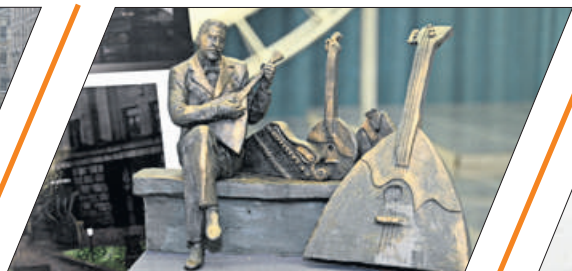
ПАМЯТНИК РУССКОМУ ЧУДУ