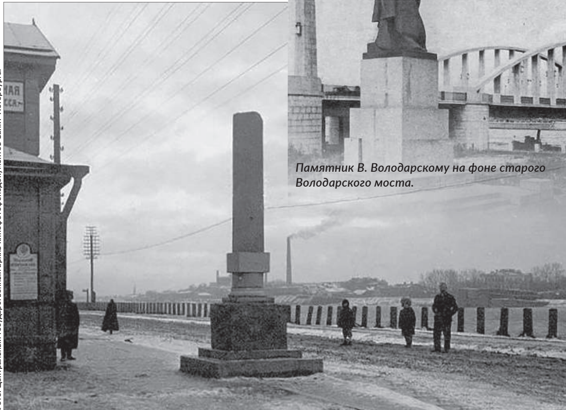
Памятный знак на месте гибели В. Володарского.

Однако памятный знак был слишком незначительным для прославления пламенного революционера, и решено было соорудить мемориал с настоящим па-