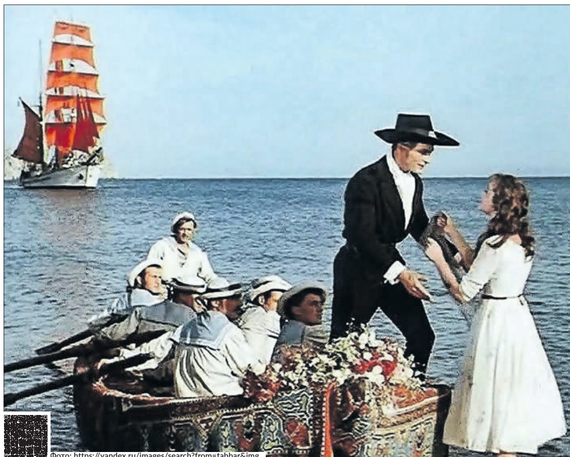
Повесть-феерия Александра Грина о непоколебимой вере и всепобеждающей, возвышенной мечте, о том, что каждый может сделать для близкого чудо. Фильм «Алые паруса», 1961 г. Реж. А. Птушко.

Её книга «Петербургская гавань Александра Грина» чита-