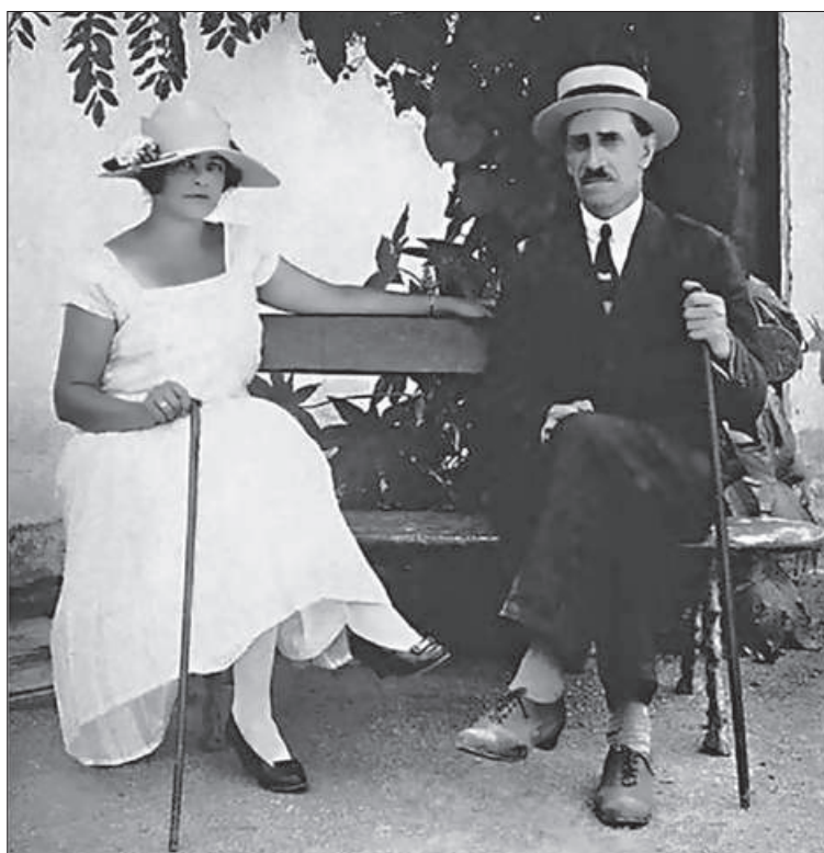
Александр Грин с женой.

В ранних черновиках повести «Алые паруса» действие разворачивается на Васильевском острове, а Благовещенский мост упоминается в одном из лучших рассказов Грина «Крысолов». С 2015 года орга-