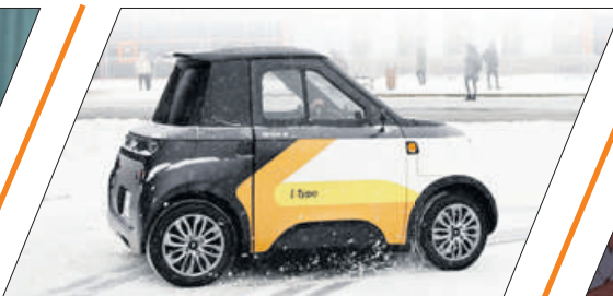
МИКРОМОБИЛИ ДЛЯ БОЛЬШОГО ГОРОДА