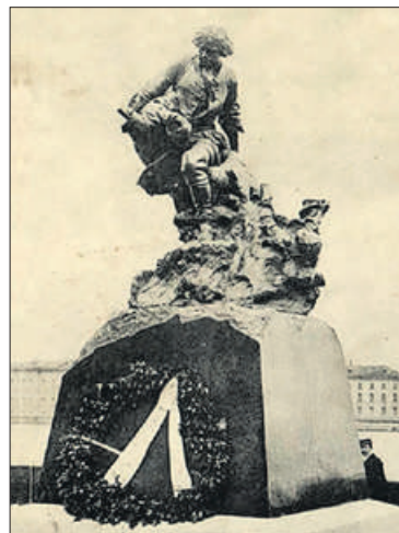
Две парных композиции, посвящённых Петру I (Пётр-спаситель – слева и Пётр-плотник – справа), появились на Адмиралтейской набережной в 1909–1910 гг.

Средств на сооружение памятника при бешеной инфляции