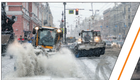
СНЕЖНЫЕ БИТВЫ: «ГОРЯЧАЯ ЛИНИЯ»