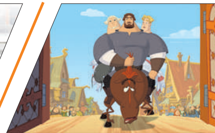
ТРИ БОГАТЫРЯ НА ПРОСПЕКТЕ БОЛЬШЕВИКОВ