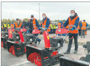
РАЙОН ГОТОВ К ЗИМЕ