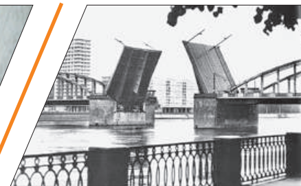
МОСТ НА ЛИНИИ ОГНЯ