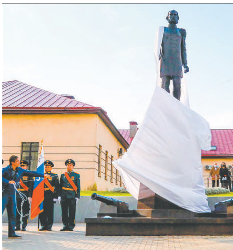
Основатель как бы смотрит на своё детище, поэтому памятник расположен лицом к заводу.