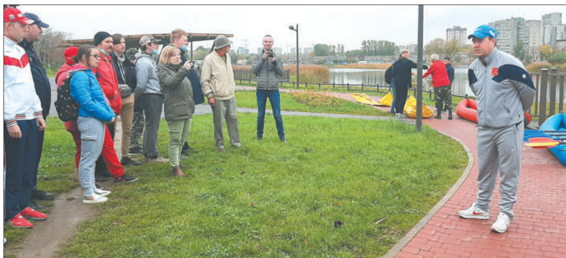
«Инновации» – это не только про компьютерные технологии и химические разработки. Они возможны и в хрупкой сфере взаимодействия между людьми.

В будущем году Специальному олимпийскому комитету Санкт-Петербурга ( http://sok.spb.ru/ ) исполняется 30 лет. Эта организация считается одной из мощнейших в Европе – и по уровню специалистов, и по количеству атлетов.