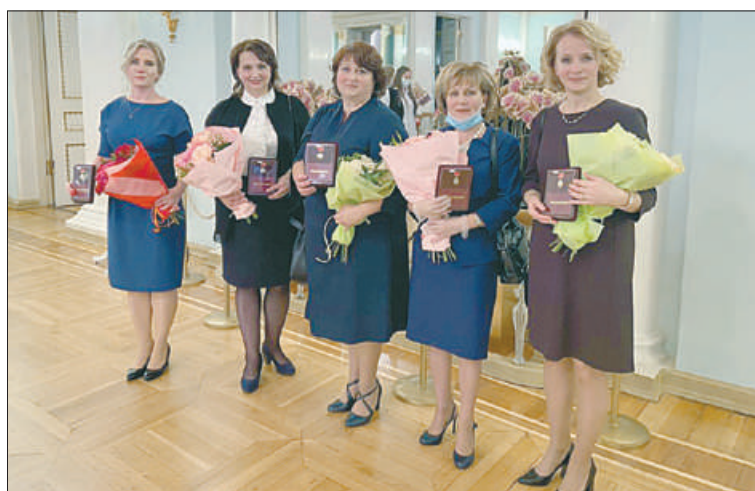
Эта петербургская награда была учреждена почти 30 лет назад. За эти годы её удостоены более 2,5 тысячи человек.