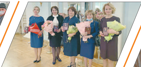
НАШИ УЧИТЕЛЯ – ЛУЧШИЕ!