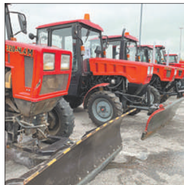
В этом году зимой будет задействовано 60 единиц уборочной техники.