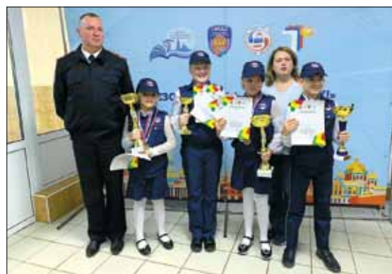
В общем зачёте команда школы № 334, выступающая за Невский район, завоевала призовое второе место!

Юные инспекторы движения – победители районных этапов конкурса «Безопасное колесо» – встретились в детском оздоровительном лагере «Солнечный», чтобы побороться за звание лучшего отряда ЮИД Санкт-Петербурга. Мальчики и девочки в возрасте 10–12 лет продемонстрировали свои знания правил дорожного движения, навыки оказания доврачебной помощи пострадавшим в ДТП, умения управлять велосипедом и способности правильно ориентироваться в дорожной обстановке. Также ребятам было предложено составить безопасный для велосипедиста маршрут по улицам города, учитывая дорожные знаки и разметку. Ребята продемонстрировали не только отличное умение управлять велосипедом, но и знание устройства двухколесного транспортного средства. Юные инспекторы движения соревновались в творческом конкурсе, где продемонстрировали выступления в непросто жанре агитбригады. Судьями на всех этапах конкурса выступили сотрудники Госавтоинспекции.