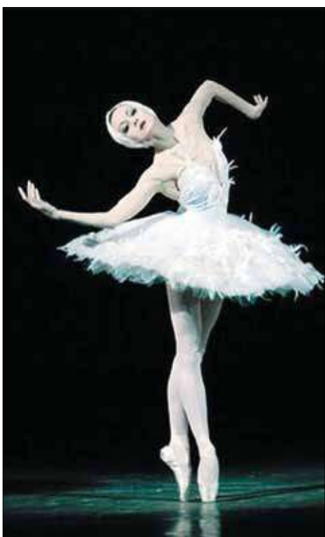
Лебедь в одноименной хореографической миниатюре Михаила Фокина на музыку Камиля Сен-Санса.

«Когда мир вокруг начал обретать реальность, я узнала сидящего человека – это был великий танцовщик Михаил Барышников».