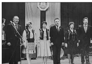
Выступление «народных» артистов заводской самодеятельности.

« Жители Невского района помнят, как на сцене бывшего ДК им. В. И. Ленина выступали Леонид Утесов, Клавдия Шульженко, Аркадий Райкин, Евгений Леонов, Владимир Высоцкий и многие другие выдающиеся артисты.