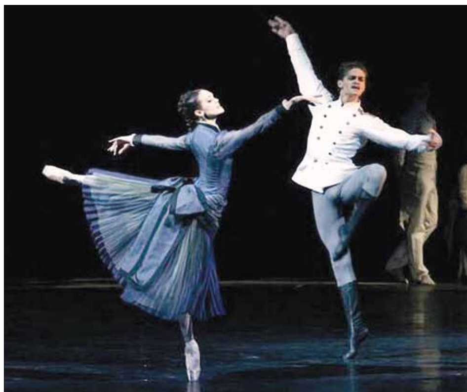
Критики отмечали глубокий психологизм партии Анны Карениной в одноименном балете на музыку Родиона Щедрина, в хореографии Алексея Ратманского.