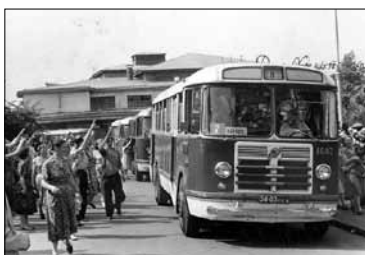
Рабочие завода «Большевик» провожают детей на отдых в летний пионерский лагерь.