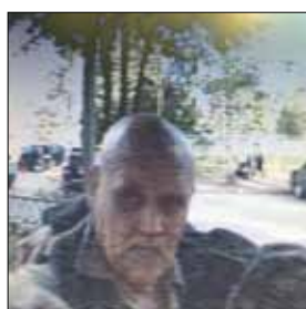
Фото неустановленного водителя.

Служба пропаганды безопасности дорожного движения ОГИБДД по Невскому району