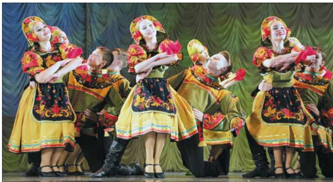
Украшением вечера стал концерт с участием детских и взрослых любительских творческих коллективов Культурного центра «Троицкий».

В 1930-е годы, когда в стране началось стахановское движение, Дом культуры был объявлен ударным цехом завода «Большевик». В это время здесь работали 13 кружков, библиотека насчитывала 30 тысяч книг, активно «боролся с недостатками» Драматический театр