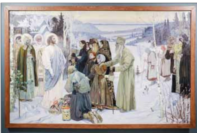
«Картина сложная во всех отношениях, после неё – хоть и на покой, – всё главное будет сказано», – говорил Нестеров о своей работе.